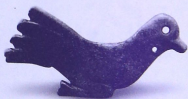
西周玉鸽 三门峡上村岭虢国墓地出土