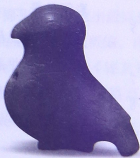
商玉鸽 殷墟妇好墓出土