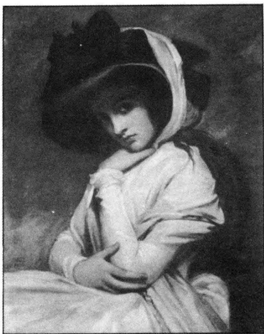
· 隆尼 戴草帽的漢彌頓女士