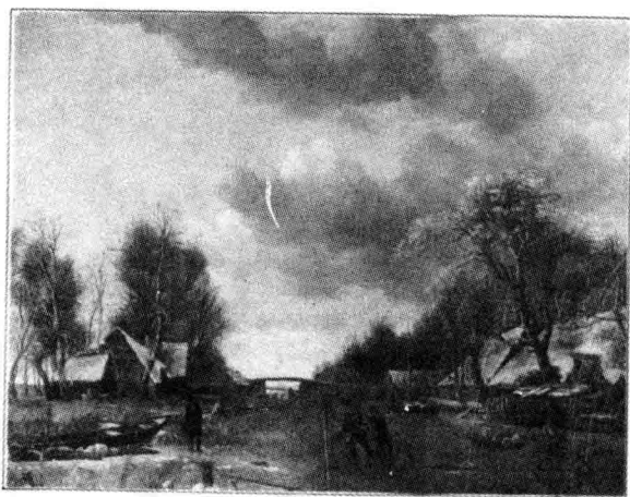
· 柯爾 冬景