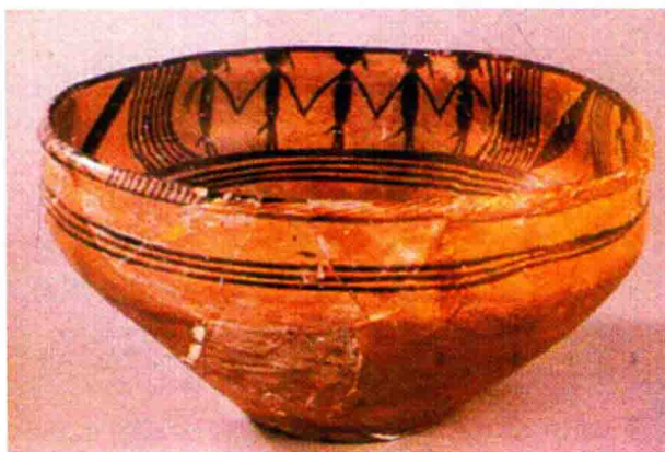
图 2-6 青海出土的“舞蹈纹盆”