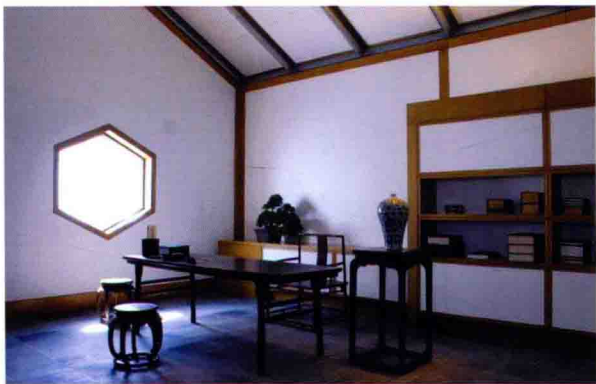
图 2-2 苏州博物馆内的明代书房陈设

中国传统的室内陈设重在表现空间的秩序性和连续关系，造型上含蓄隽永，烘托出内韵深厚的空间序