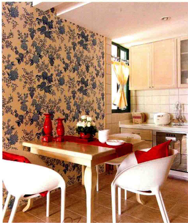
图 1-1 室内的明快色彩会让我们身心愉悦

“人，诗意地栖居在大地上”——哲学家海德格尔之所以格外喜欢荷尔德林的这句诗，是因为道出了生命的深邃与优雅以及对精神生活的追求。我国的室内环境从上个世纪80年代末开始普遍有设计的概念，到现在已进入了一个新的阶段。很多人或是设计师在很认真地装饰着我们的室内环境时，把人的诗意居住忘记了，无意中制造着要人适应的行为规范，这个规范就是当时香港传来的装修样板。上世纪90年代的人以住在宾馆式的家里为荣，特别是房地产商提出的“给你一个五星级的家”的口号，似乎最舒服的家就是五星级的宾馆。而随着我们生活个性意识的逐渐觉醒，发现生活，特别是适合东方人的生活方式已被西方式的设计样式扭曲时，开始渴望自身价值的回归，开始寻求利用陈设设计去构筑“自身文明化和个性鲜明”的生活方式。而室内陈设设计作为室内设计的重要设计深入部分，近年来也越来越被大家认识到其重要性。所以说室内陈设设计在我国被提出首先是因为我们生活水平不断地提高，开始注重对精神的追求。