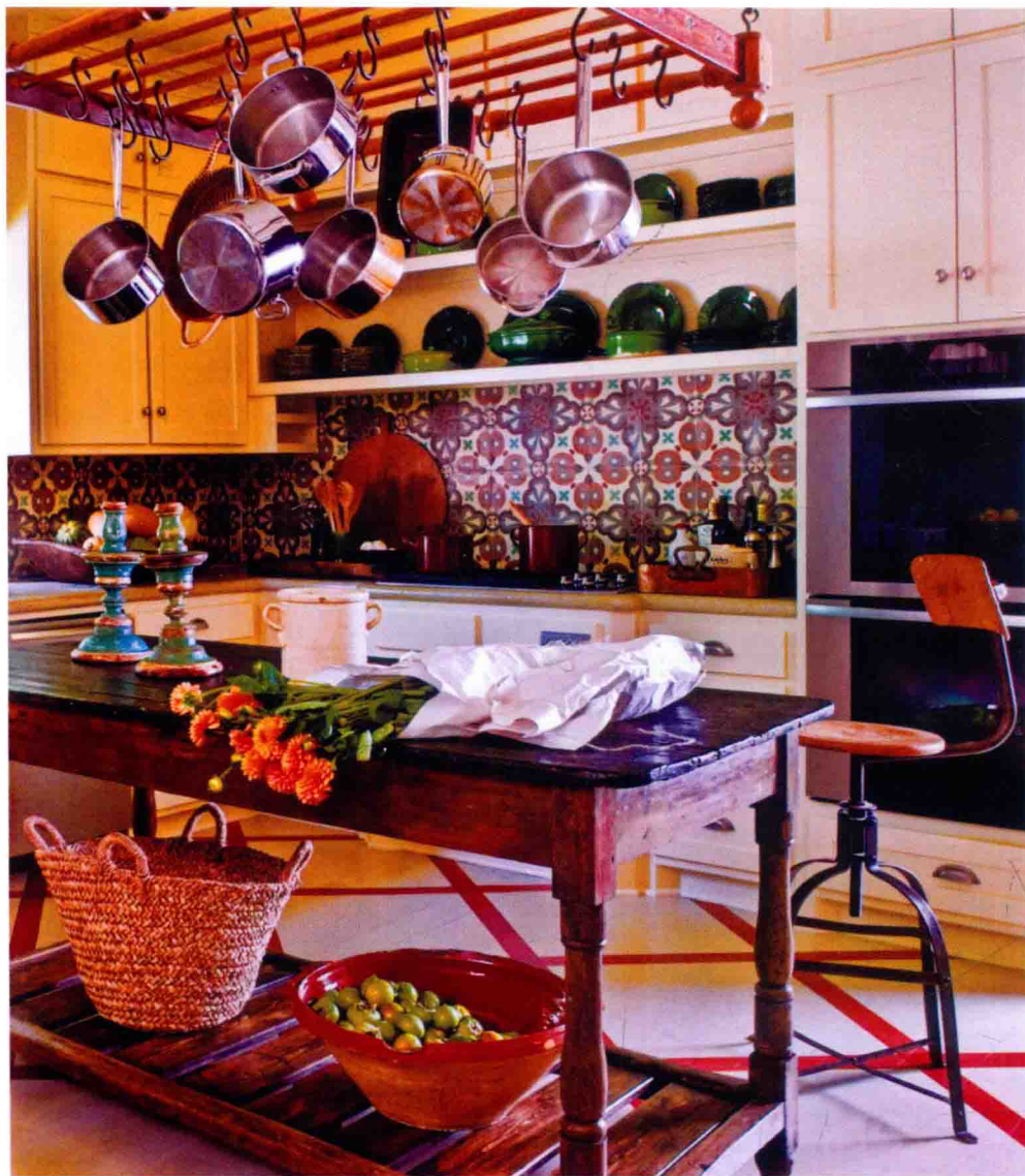
图 1-6 赏心悦目的厨房陈设