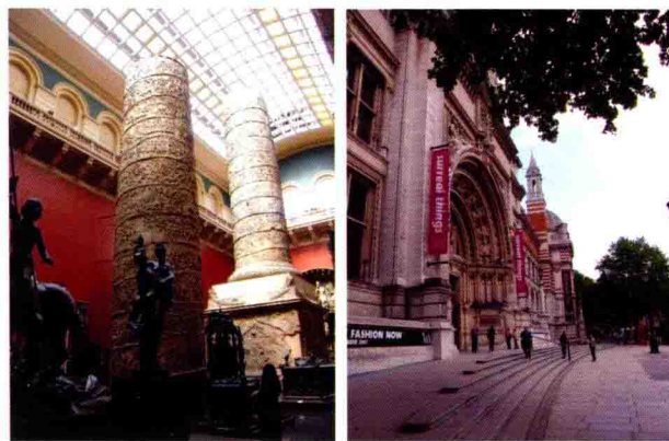
图 2-1 维多利亚与阿尔伯特博物馆