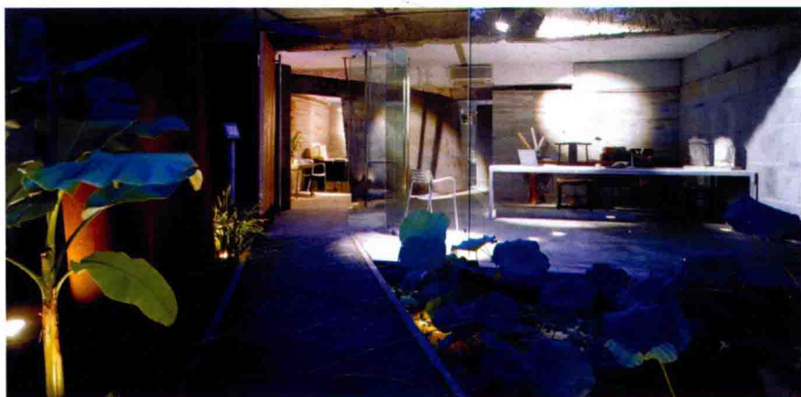
图 2-4 登琨艳设计的具有东方传统文化色彩的室内陈设环境