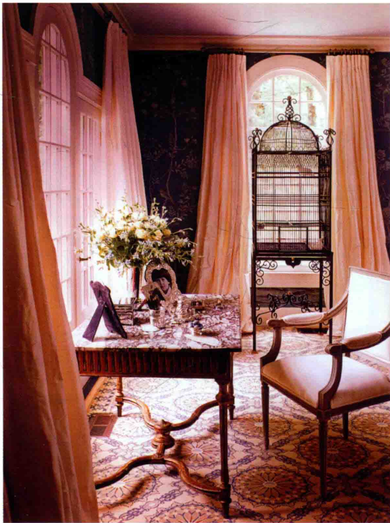
图 1-5 对优美和细节的追求使这个空间充满了优雅的气息