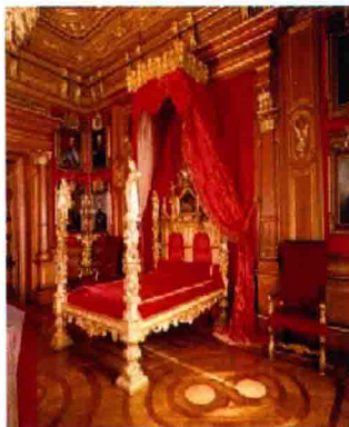
图 2-3 法国宫廷艺术风格的室内陈设