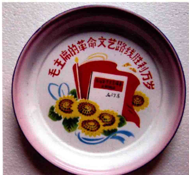
图 1-4 具有时代特点的陈设品

所谓“陈设艺术”，有两层具体的含义。首先，陈设的“软”是相对其他硬质材料而言的。在一般的室内空间设计中，人们注重的往往只是室内空间的硬装饰部分如空间的结构、格局的划分，天花、地面、墙体的装饰等等，选用的材料多为花岗岩、大理石、瓷砖、玻璃、金属等硬质的材料。而对家具和灯具、窗帘等配套装饰的选择却被放在了可有可无的位置，更谈不上实施系统的室内配套设计了。“陈设艺术”的另一层含义也是至关重要的，是指室内陈设品与人之间建立的一种“物人对话”的关系。实际上，因为陈设品所具有独特的材质、形状和花色，天生就具备了较硬装饰更容易与人产生“对话”的条件。这些条件通过人的视觉、触觉等生理和心理的感受而存在并体现其价值。如：触觉的柔软感使人感到亲近和舒适；造型线的曲直能给人以优美或刚直感；形的大小疏密可造成不同的视觉空间感；色彩的冷暖明暗和色调作用于人的视觉器官，在产生色感的同时也必然引起人的某种情感心理活动；不同的材质肌理产生不同的生理适应感；不同的花色取材，可以使人产生一系列的联想，好像置身于多样的空间环境。充分利用陈设品的这些“与人对话”的条件或因素，能营造出某种符