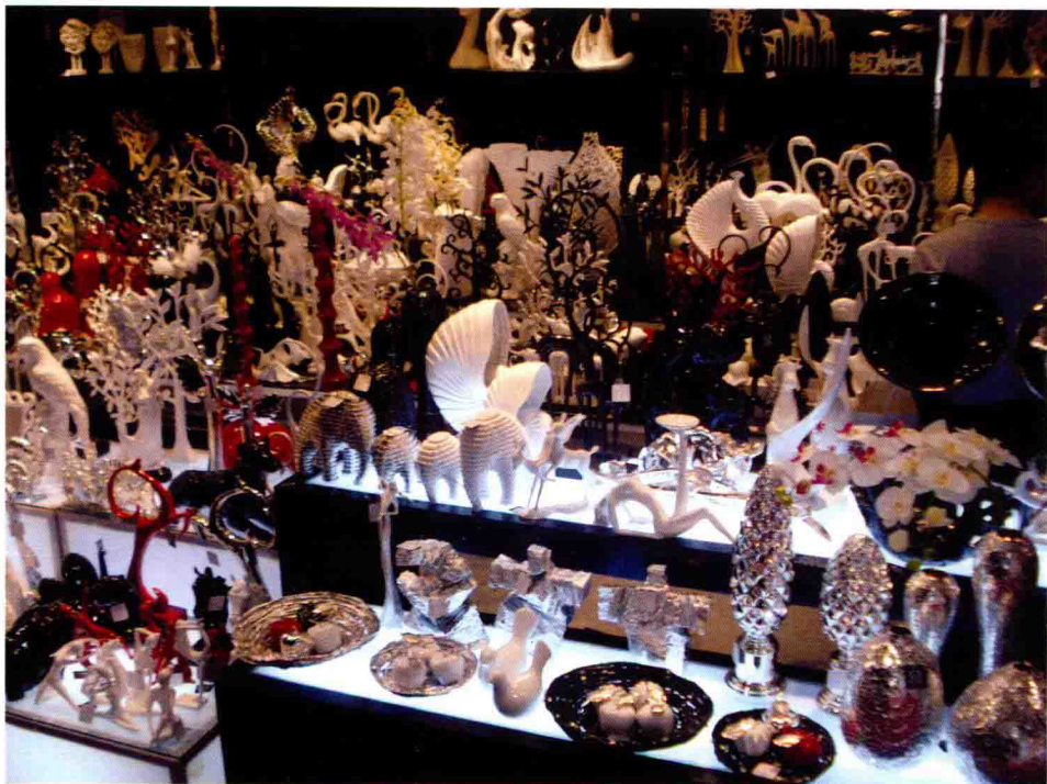
图 1-2 2010 年广州春季家具博览会上琳琅满目的陈设品

其次，我们很多城市精装修房的出现也催化陈设艺术产业，伴随国家对精装修房的要求和扶持政策的不深入以及精装房的推广更加普及，没有装修只有陈设已经是一种趋势。在毛坯房时期，设计师做装修设计或者说是装修和配饰的全套服务；而在精装修房来临的时期，空间装修这一块已被省去，陈设的作用日益凸显，消费者可以把更多的精力放在陈设设计上。从设计师方面来看，毛坯房装修越来越少，设计师的工作重心也逐渐向陈设艺术配套设计服务靠拢。在精装修房的推广发展下，“重装饰、轻装修”的趋势已来临，消费者已越来越重视陈设设计的生活空间。客户的要求也在提高，除了简单的居室设计外，还需要设计师对后期的陈设艺术进行整体规划，这也给设计师们提出了新的课题（图 1-1）。