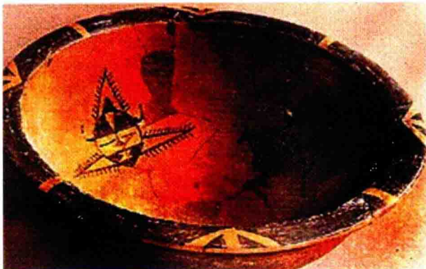
图 2-5 西安半坡村出土的彩陶

所谓室内陈设风格,是指具有一定代表性的装饰设计手法,形成的有特色的室内氛围。室内陈设风格的形成和发展受到社会思想、文化、经济、科技以及艺术形式蜕变和演进的影响,某种时尚形式的产生同样受当时、当地的社会大众文化素质、审美的制约。