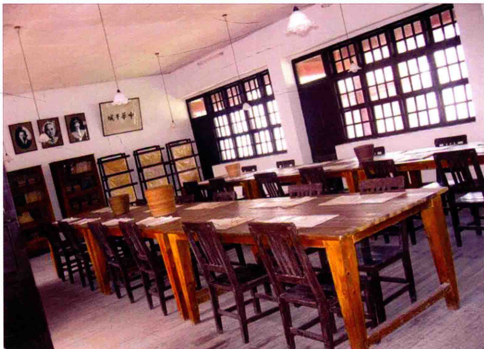
图 1-3 黄埔军校的展览馆