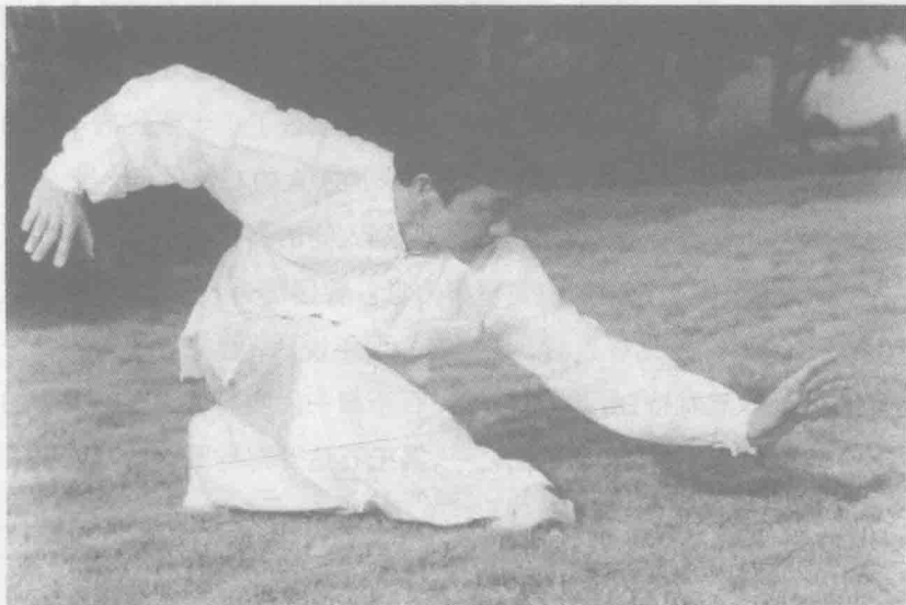
太极拳中的行意拳

考、勤动脑筋的人自然也会有与他人不同的头面特征。古人也早就认为，潜心读书本来就是一种气功态，因而文化人与其他人的面部气质确实不一样。