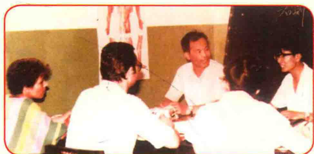
1986年给南斯拉夫留学生讲课