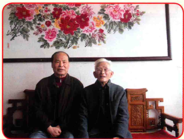
2012年初在广州与当代著名的中医临床家李可老先生合影