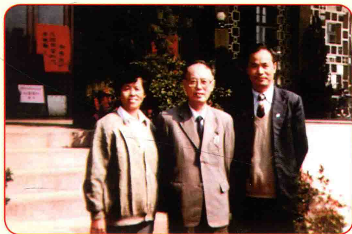
1990年在南昌开 “七五”攻关课题鉴定 会，与国医大师周仲瑛 教授（中）合影