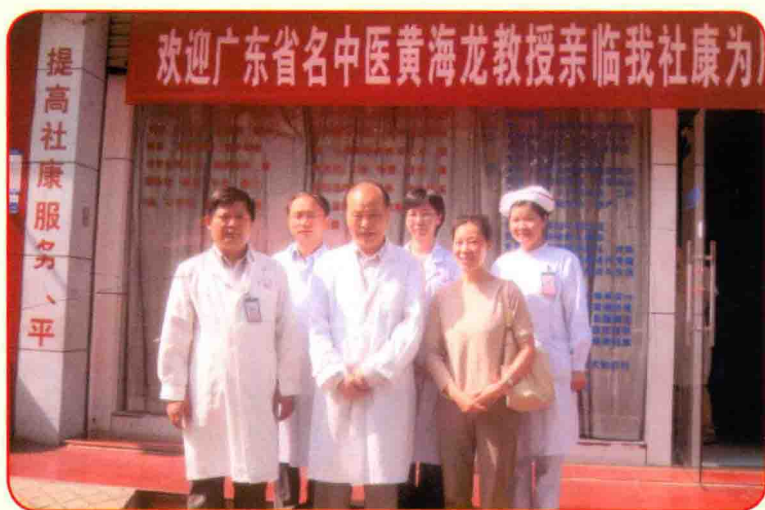
下社康为居民义诊