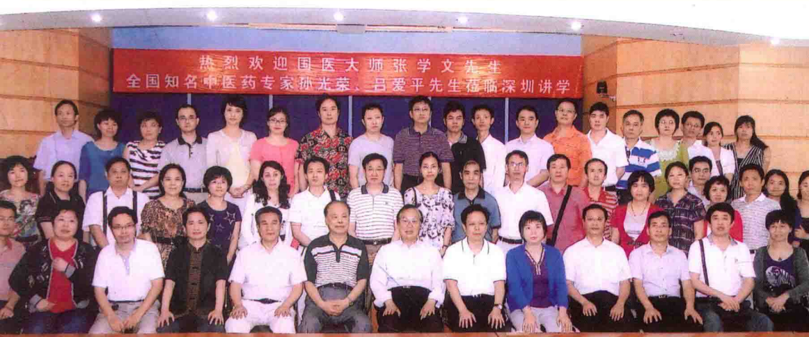
欢迎国医大师张学文教授（右7）来深圳讲学