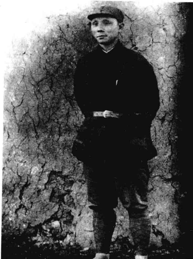
1938年2月，邓子恢在龙岩东肖邓厝村的留影。