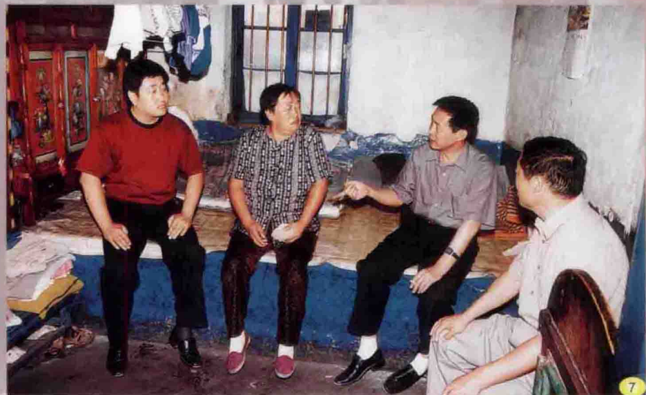
通化市国家税务局多年来扶贫帮困、救助失学儿童等，局领导亲自到贫困户中了解情况