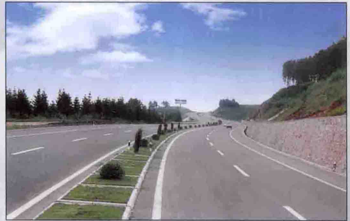
通梅一级公路工程