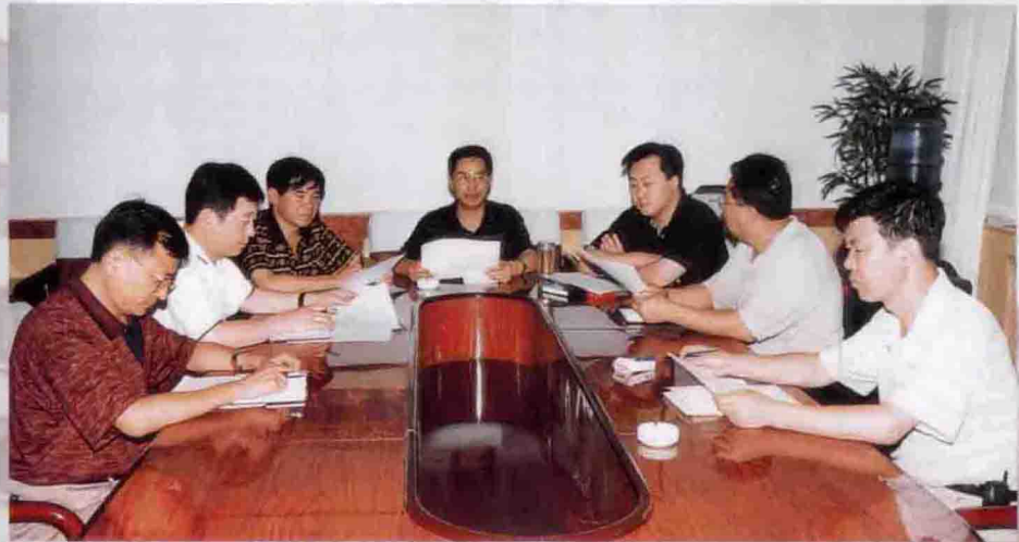
团结奋进、开拓创新的领导班子