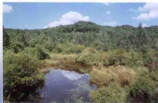
哈泥河湿地自然保护区

通化市林业是吉林省重点林区之一，森林资源十分丰富。是个“七山一水分半田，半分道路和庄园”的山区市。浩瀚林海中有誉满国内外的新“四宝”人参、红松籽、哈什蚂油和鹿茸。有黑熊、梅花鹿等 200 多种野生经济动物和山参、刺五加、细辛等 2 000 多种野生经济植物，是闻名全国的绿色宝库。