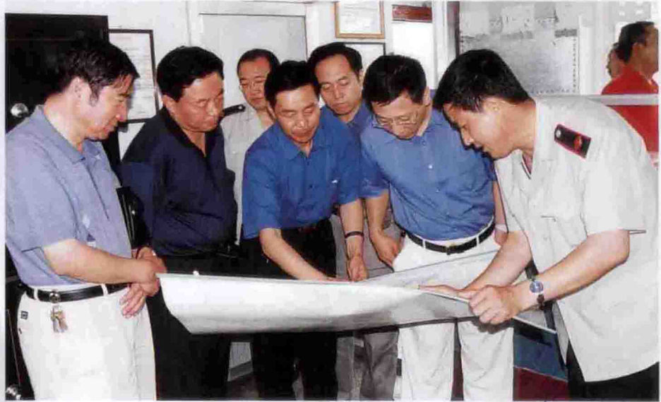
省局赵晓明局长来通化视察工作