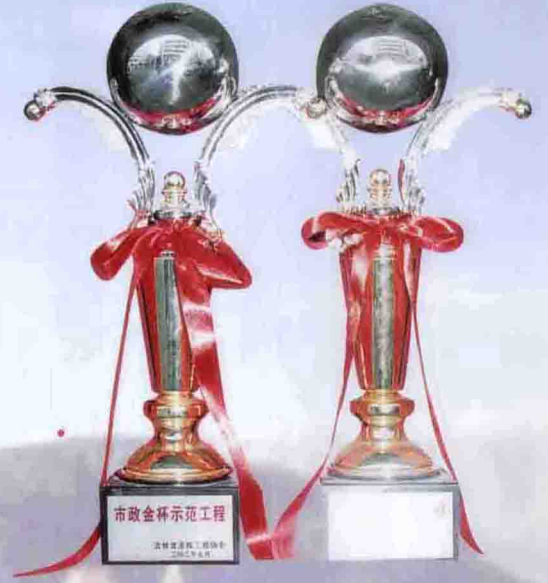
2002年荣获省市政协会“市政金杯示范工程”