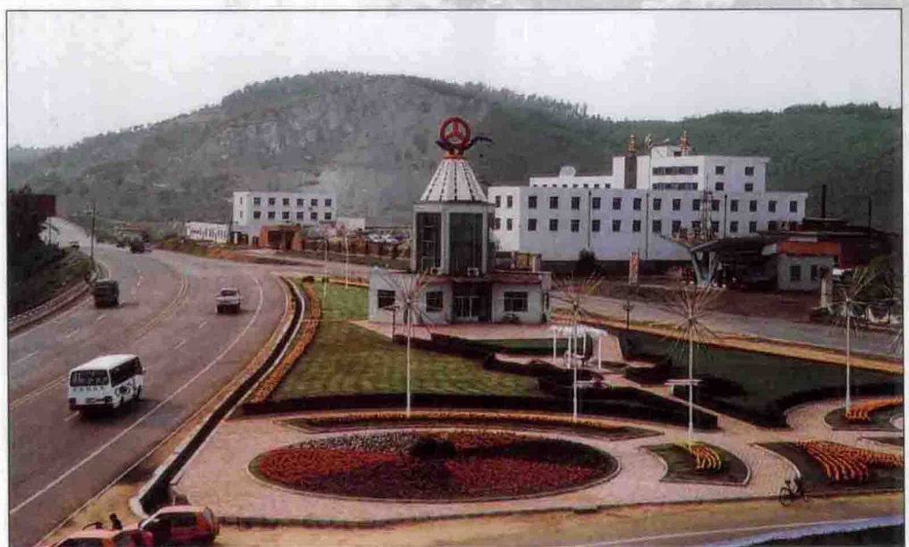
通梅一级公路通化北出口绿化景点