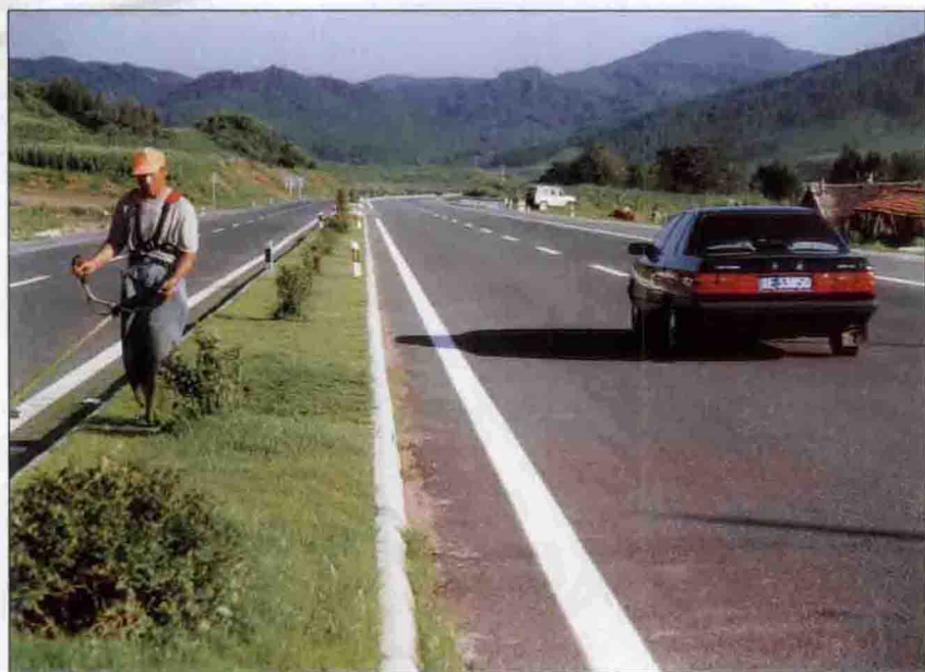
园工正在养护作业

为实现小康社会建设目标，“十五”期间将继续加快交通运输建设。计划交通建设投资27.9亿元，新改造干线公路1121公里，农村公路1635.7公里。公路客运量达到6381万人，客运周转量达到235932万人，分别增长312%和309%；货运量8571万吨，货运周转量300087万吨公里，分别增长306%和309%。