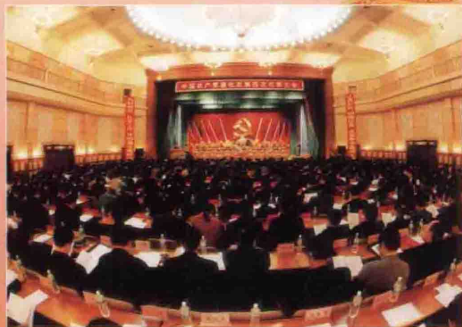
2002年3月11日中国共产党通化市第四次代表大会隆重召开