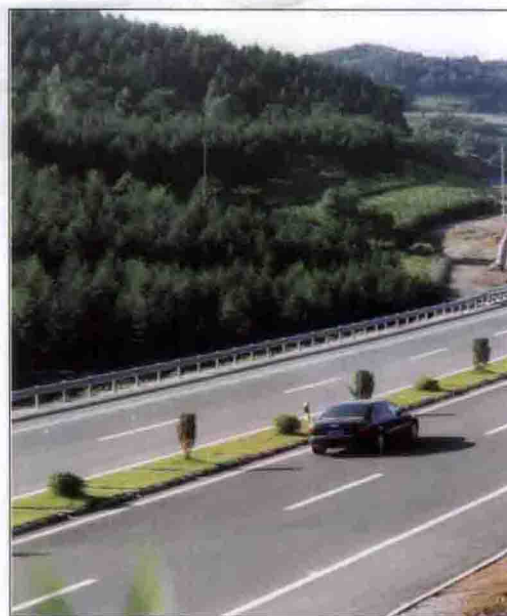
通梅一级公路通沟岭路段