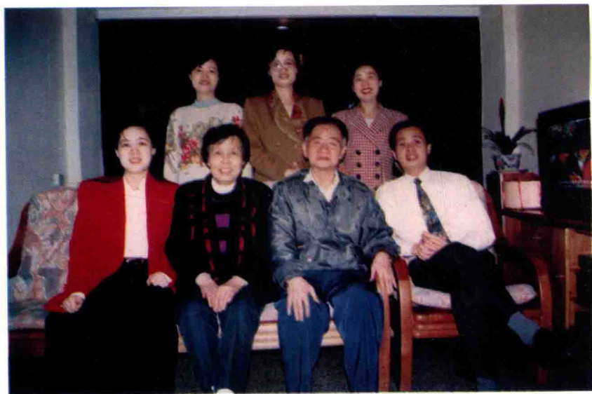
作者夫妇及其子女合影