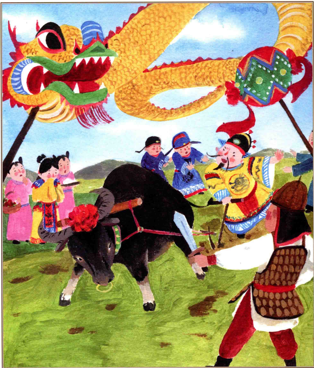
二月二，龙抬头·二月二，龙抬头