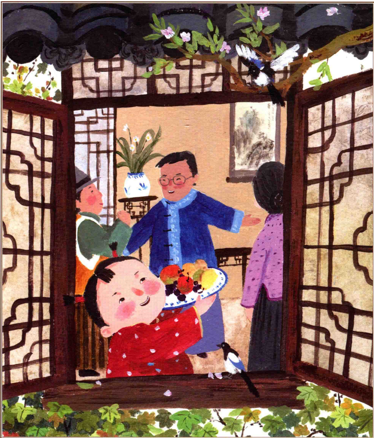
二月二，龙抬头·喜鹊喳喳进了宅