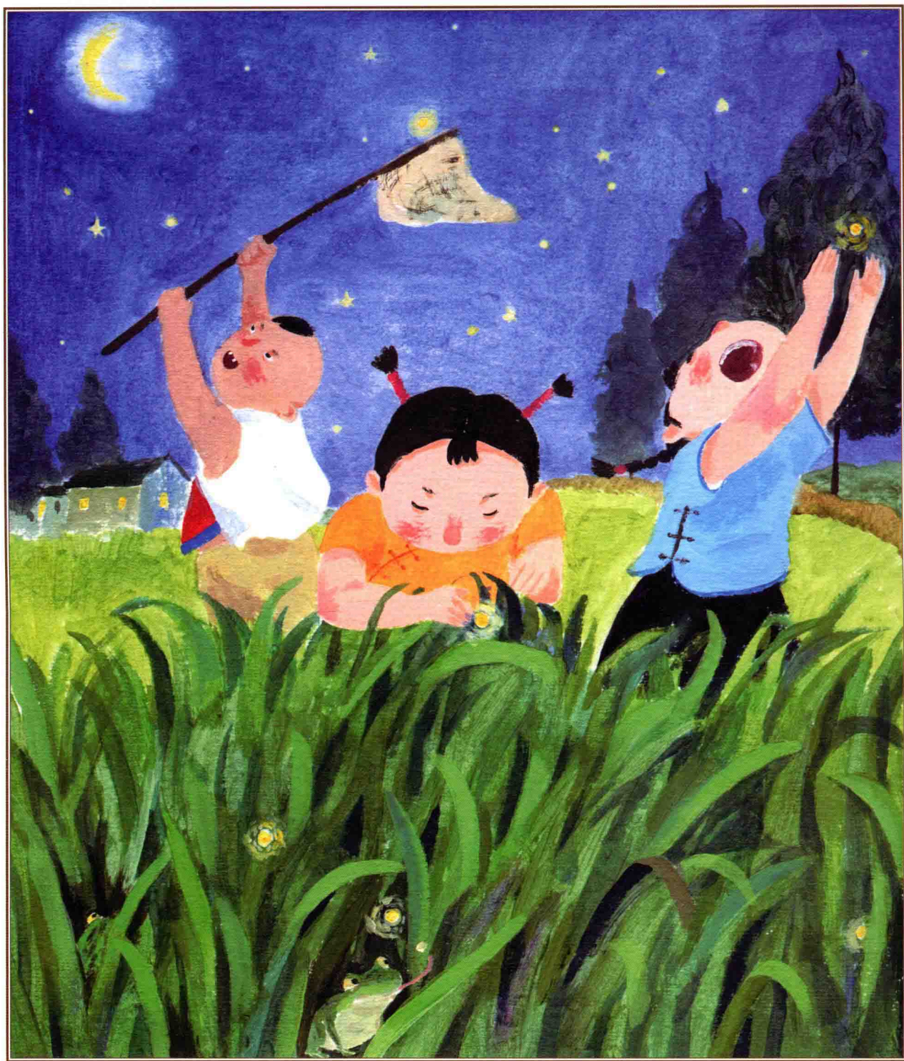
二月二，龙抬头·你的湾，我的湾