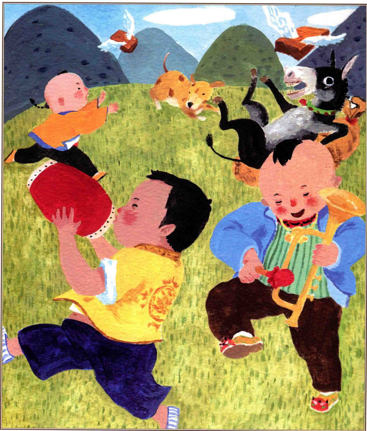
二月二，龙抬头·颠倒歌