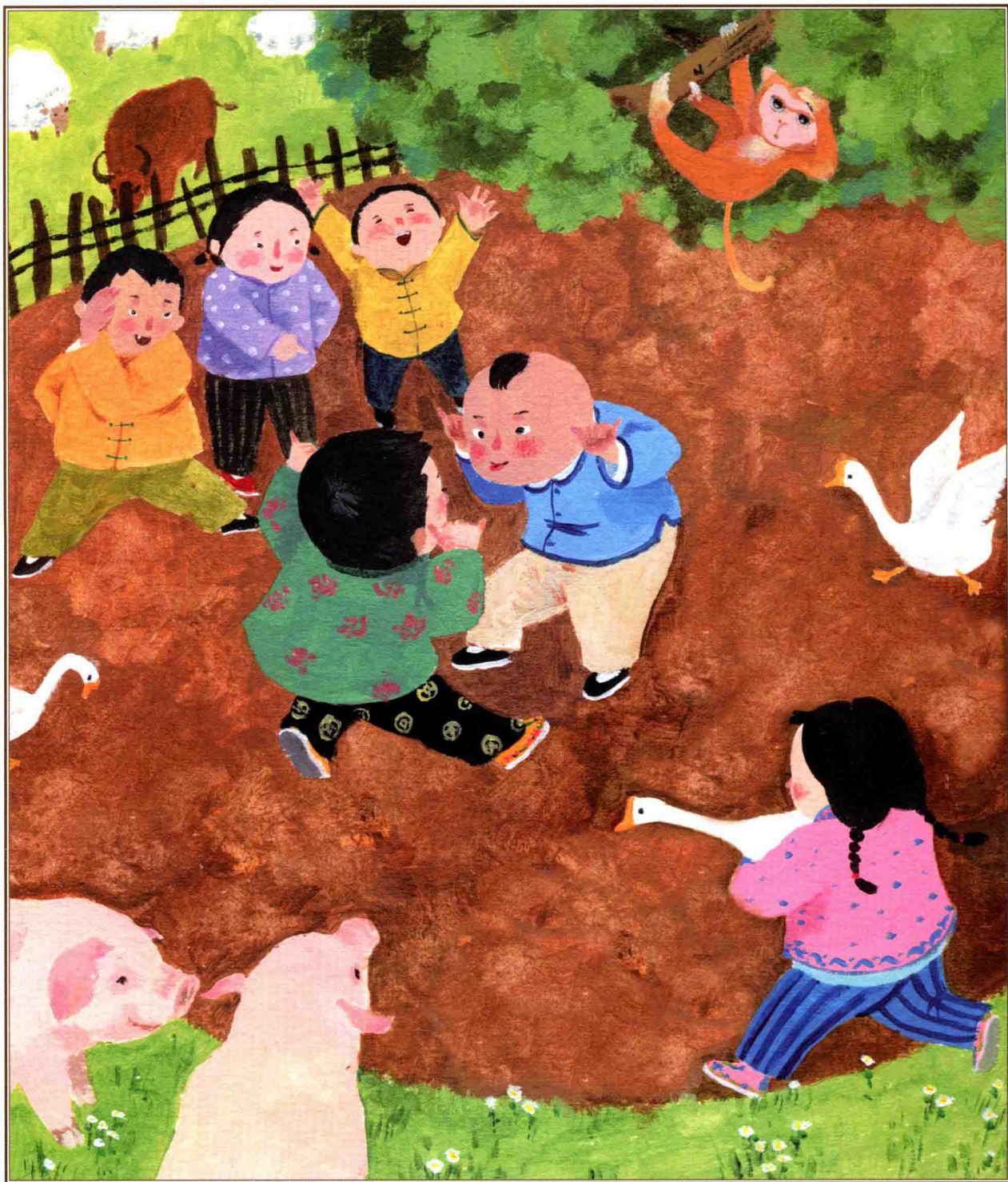
二月二，龙抬头·对唱谜语