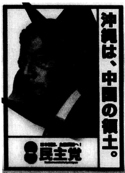
图1 冈田克也先生任日本民主党党首期间的宣传画：冲绳是中国的领土

后来，有人告诉我，冈田克也先生担任党首期间，日本民主党经常公开宣传：冲绳是中国的领土（见图1）。我看过之后才恍然大悟，原来连日本高层的有识之士都认为琉球是中国领土，怪不得有那么多日本人担心琉球回归中国。