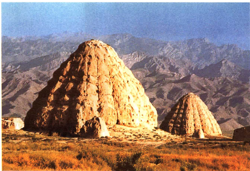
二 银川西夏陵1号、2号陵台