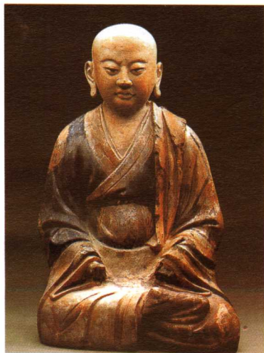
四 贺兰宏佛塔出土罗汉坐像