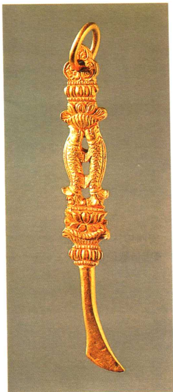
五 临河高油房窖藏出土 金剔指刀