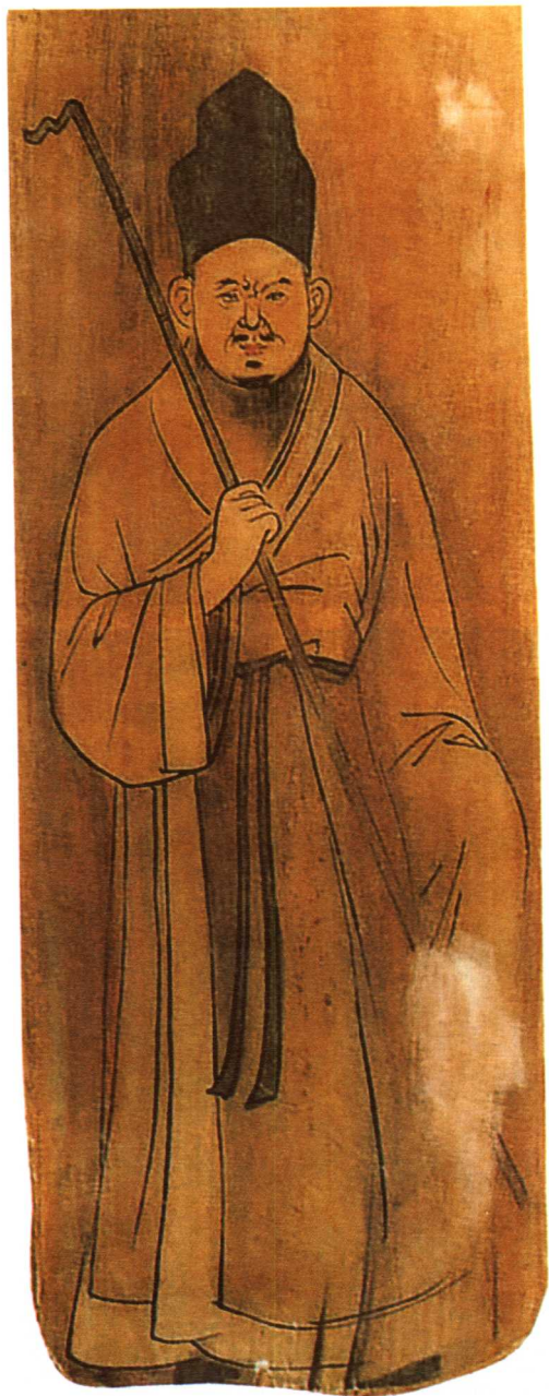
六 武威西郊林场西夏墓出土 “蒿里老人”木板画