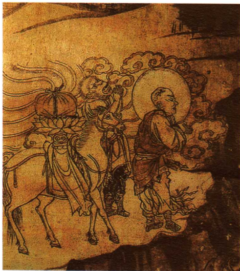
七 安西榆林窟第3窟 《唐僧取经图》