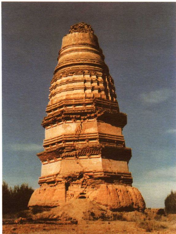
三 维修前的贺兰宏佛塔