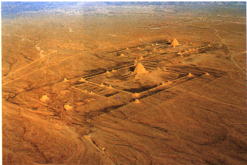
一 银川西夏陵1号、2号陵（航拍）