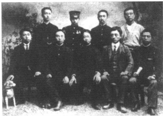
华兴会部分会员。（前排左起第一人黄兴，第三人胡瑛，第四人宋教仁，第五人柳扬谷；后排左起第一人章士钊，第四人刘揆一）

按照杨度所提供的三马信号，刘道一在雷打石窑场里与马福益的部下马树德取得了联系，并通过马树德见到了马福益。在民族大义的激励下，马福益同意与黄兴见面。在一个寒冷的雪夜，马福益与黄兴在湘潭茶园铺的废煤洞里见