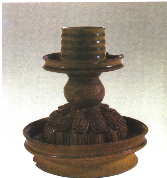
青瓷莲花灯台（南朝）