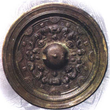
永安五年神兽纹铜镜（三国）