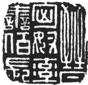
图1-1 “晋匈奴率善百长”印

魏晋南北朝时期的中华各民族，仍以汉族为主体，这是毫无疑问的。但这个时期有明文记载的少数民族，其民族类别和数量都有明显的增加，并且有一些民族在一定时期和一定的地区内成为占统治地位的民族，史称“十六国”。其实，居统治地位的少数民族，不止五个，也不止“十六国”。当时的北方，还有乌丸人、卢水胡人、山胡人、稽胡人、高车人、丁零人、柔然人及契胡人等。在江南、岭南，则有蛮人、俚人、僚人、山越人和溪人等，他们都是早已居住在今天中国这块土地上的古老少数民族。少数民族不仅族别甚多，而且人口数量不少。《晋书》卷二《文帝纪》曾对当时北方的少数民族内徙者的数量作过估计，谓曹魏之末的景元四年（公元263年），“九服之外，绝域之氓，旷世所希至者，咸浮海来享，鼓舞王德，前后至者八百七十余万口”，几乎占西晋灭亡吴国后全国总人口数1600多万的一半还多。西晋初年郭钦曾指出：“魏初人寡，西北诸郡，皆为戎居” ① 。江统也说：“关中之人，百余万口，率其少多，戎狄居半” ② ，即少数民族占到百万关中人口的50%（参见图1-1）。