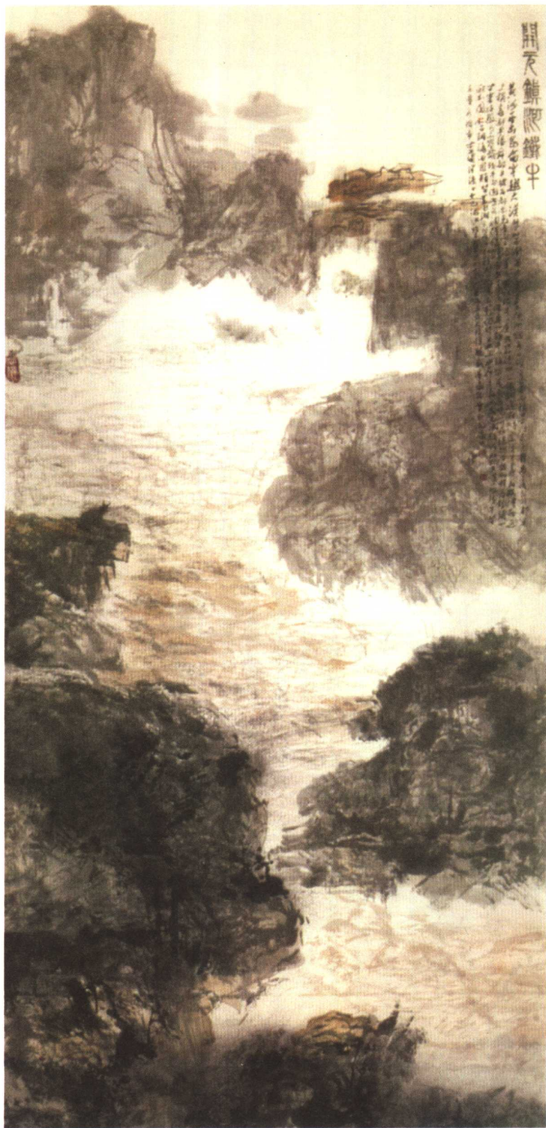
■ 蒲州铁牛 360×143cm 王学仲作