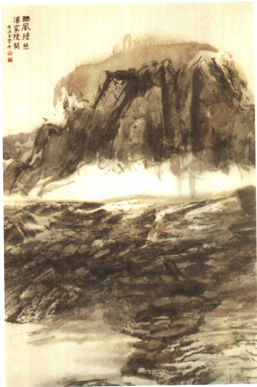
■ 汉家陵阙 55×100cm 王学仲作