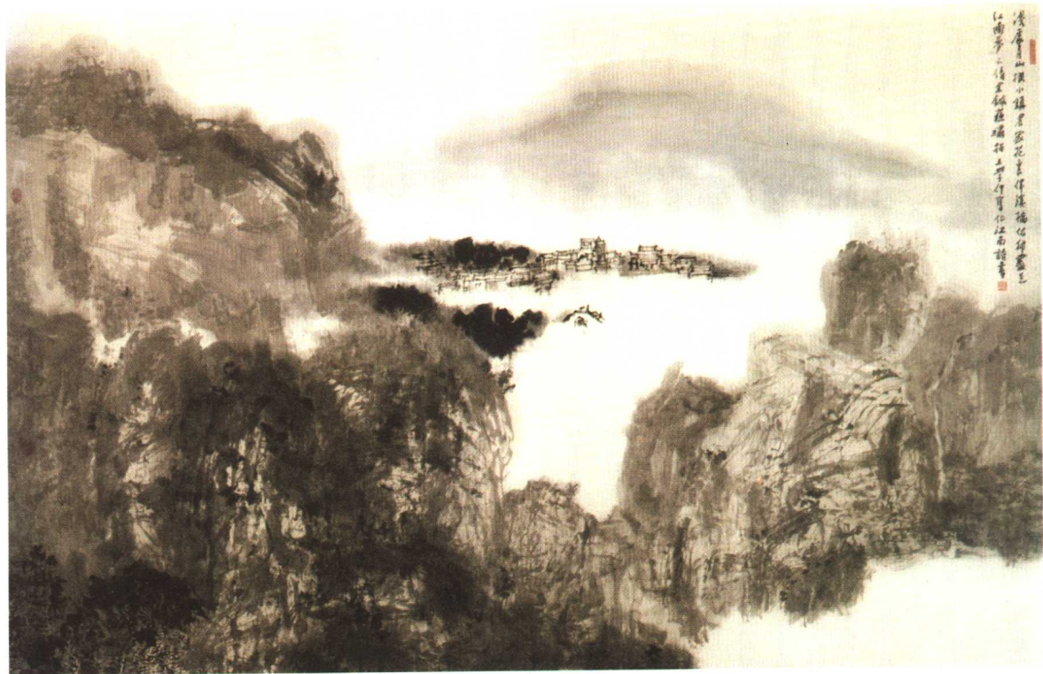
■ 路转溪桥忽见 242×158cm 王学仲作