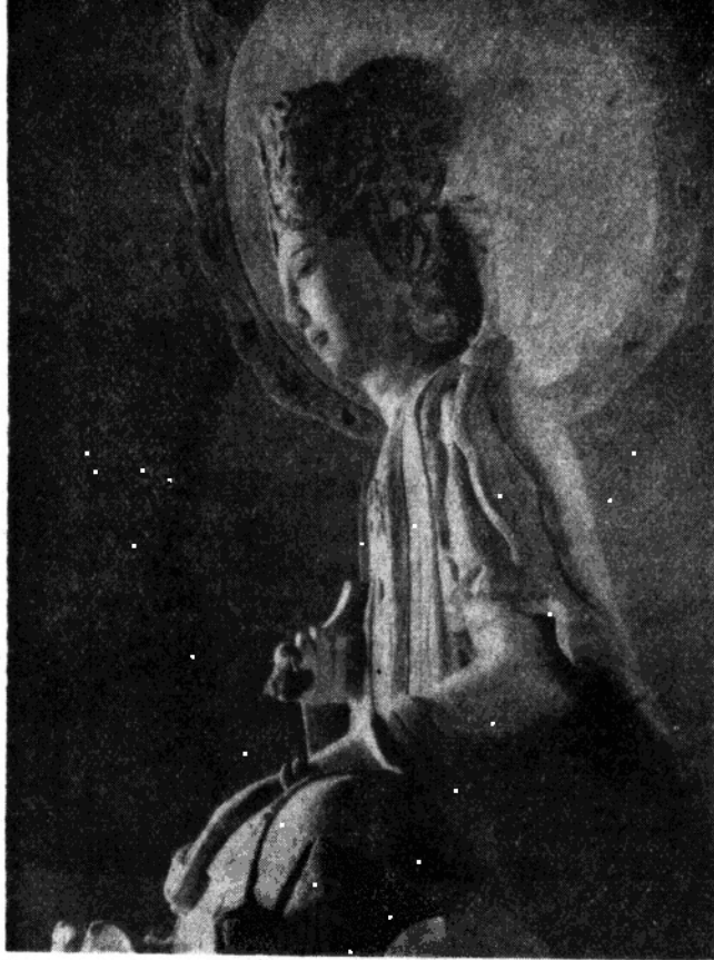
12. 宋 普賢菩薩〔石刻〕