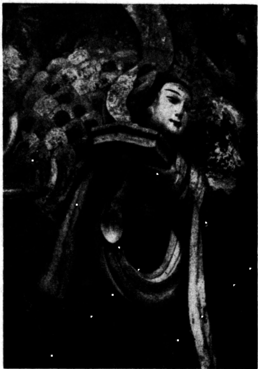
13. 宋 天 女 [石刻]