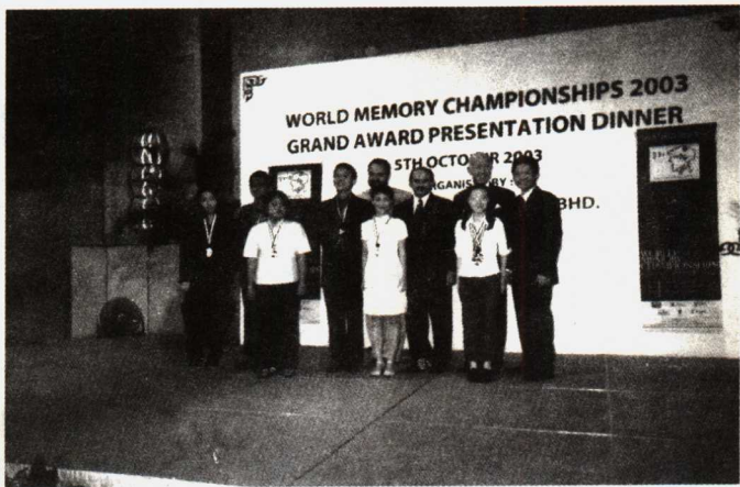
第 13 届世界记忆锦标赛获奖者合影

对于前两个问题,许多人都能轻易回答出来,对于最后一个问题,几乎没人能准确说出答案。为什么?9·11 事件和上大学的第一天都具有非同寻常的意义,大脑对非同寻常的事物会牢记不忘。我们之所以对前两件事情还能记得,就是因为这两件事情与非同寻常的意义发生了内在的联结。