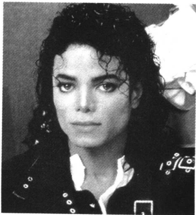
美国摇滚歌手迈克·杰克逊

其实，魅力并不是什么神秘的东西，它只是一种学问、一种技能，只要努力去研究，常常去磨炼，魅力自然而然会成为你性格的一部分。在别人看来，那魅力好像是浑然天成，但是在有魅力的人心中，他明白自己下了多少苦功。