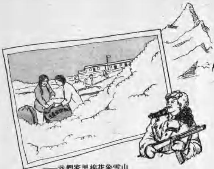
——我們家里棉花象雪山