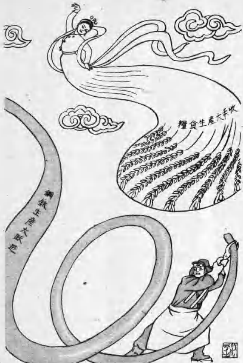
1958年国庆节的 “紅綢舞”和“孔雀舞”