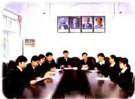
务实创新的领导班子