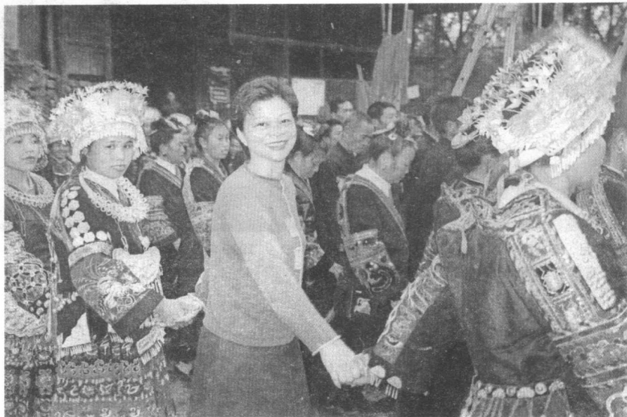
与苗族姑娘牵手踩堂。