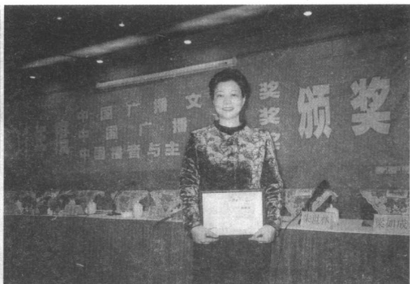
2002年10月,《柳州刺史柳宗元》获中国广播剧奖连续剧一等奖、最佳导演奖等。图为在太原颁奖会上留影。