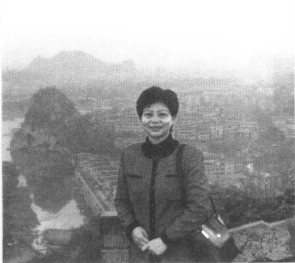
叠彩山上观桂林，烟雨蒙蒙之中秀丽山水婀娜多姿(2000年秋)。