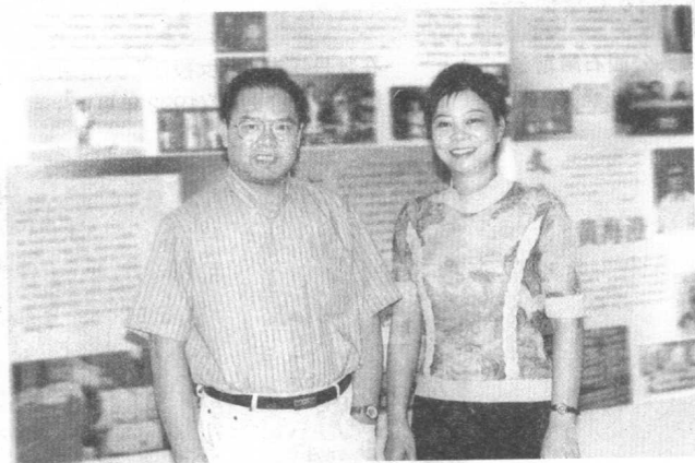
广西十三年文学艺术成果展示会上,与时任自治区 党委副书记潘琦同志合影。