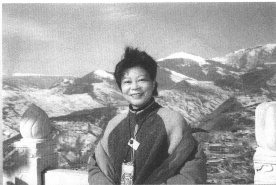
登上五台山高的大螺顶，却原来：山外更有山(2002年11月)。