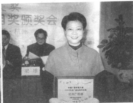
2005年12月,《瓦氏夫人》获中国广播影视大奖。图为在杭州颁奖会上领奖。