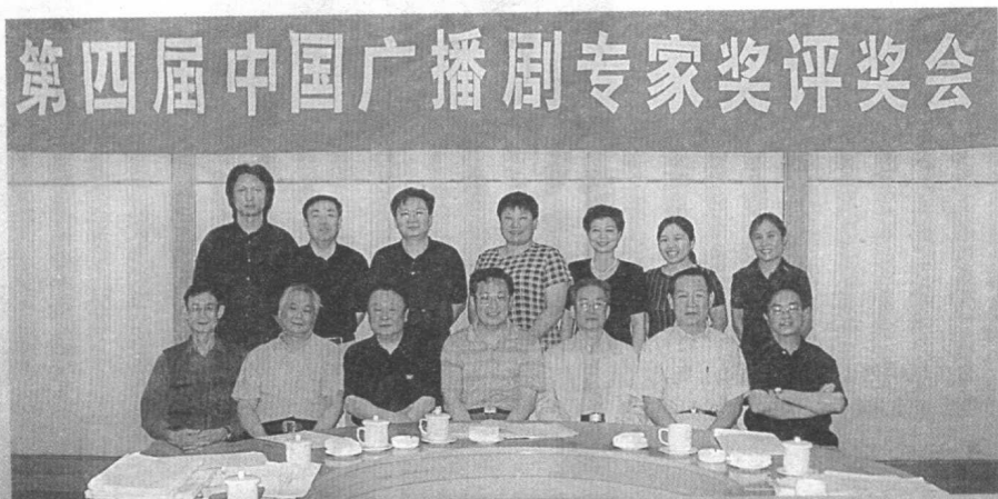
2004年6月,第四届中国广播剧专家奖评奖会全体评委合影。