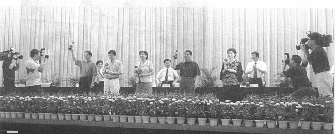
2006年6月,在第五届广西文艺创作铜鼓奖颁奖仪式上。