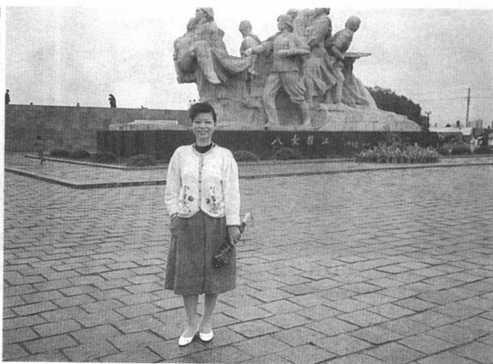
在牡丹江市“八女投江”大型雕塑前，感悟“生命 诚可贵，自由价更高”(1992年夏)。