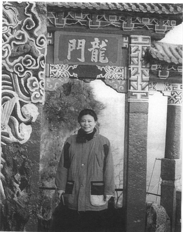
站在昆明西山龙门石坊边，可尽 情领略百里滇池的美(1996年1月)。