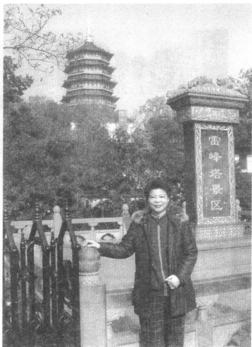
游杭州西湖，怀古雷峰塔(2005年12月)。