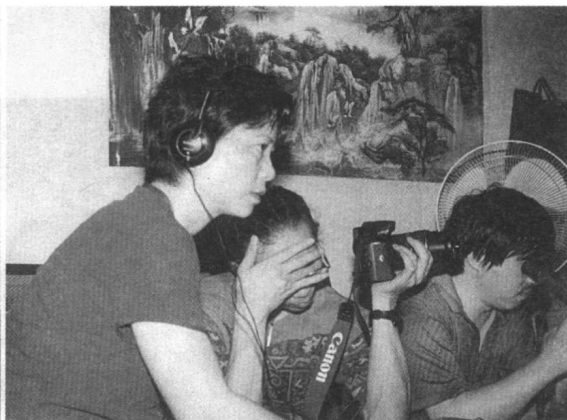
1999年6月，采风京岛。