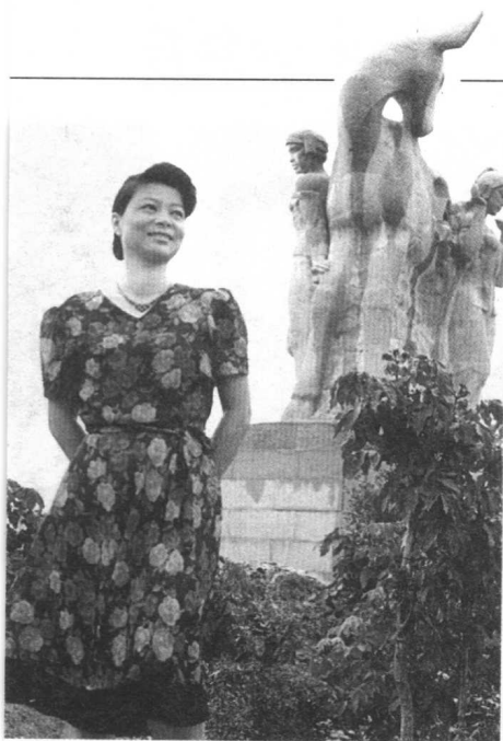
来到三亚市鹿回头公园石雕前也 回个头(1991年初夏)。