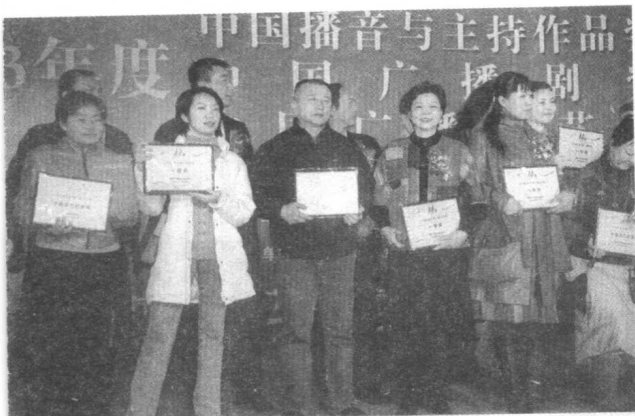
2004年12月,《魅力永恒的刘三姐》获中国广播文艺奖综艺节目一等奖。图为在东莞颁奖晚会上领奖。