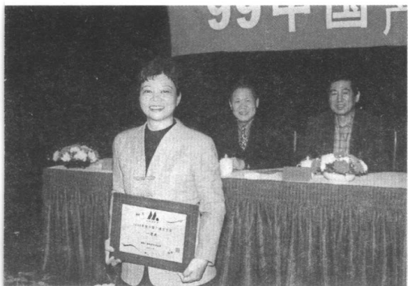
2001年12月,《最忆漓水情长时》获中国广播文艺奖曲艺节目一等奖。图为在福州颁奖会上领奖。