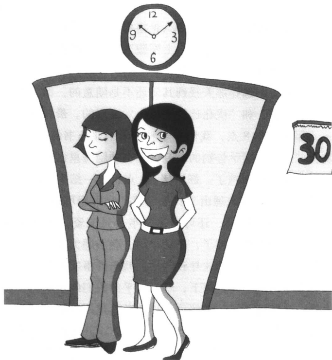
15号、30号报到，乃兵家大忌

可惜当时我就没有注意到这个小细节。报到这件事，现在分析起来，对我后来的发展或多或少产生了很多不好的影响。