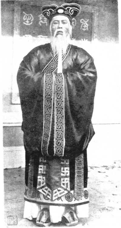
● 影片《孔夫子》(1939) 剧照。