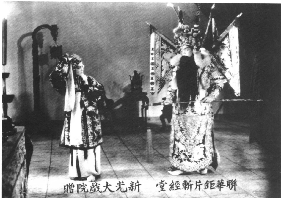
● 影片《斩经堂》(1936) 剧照。