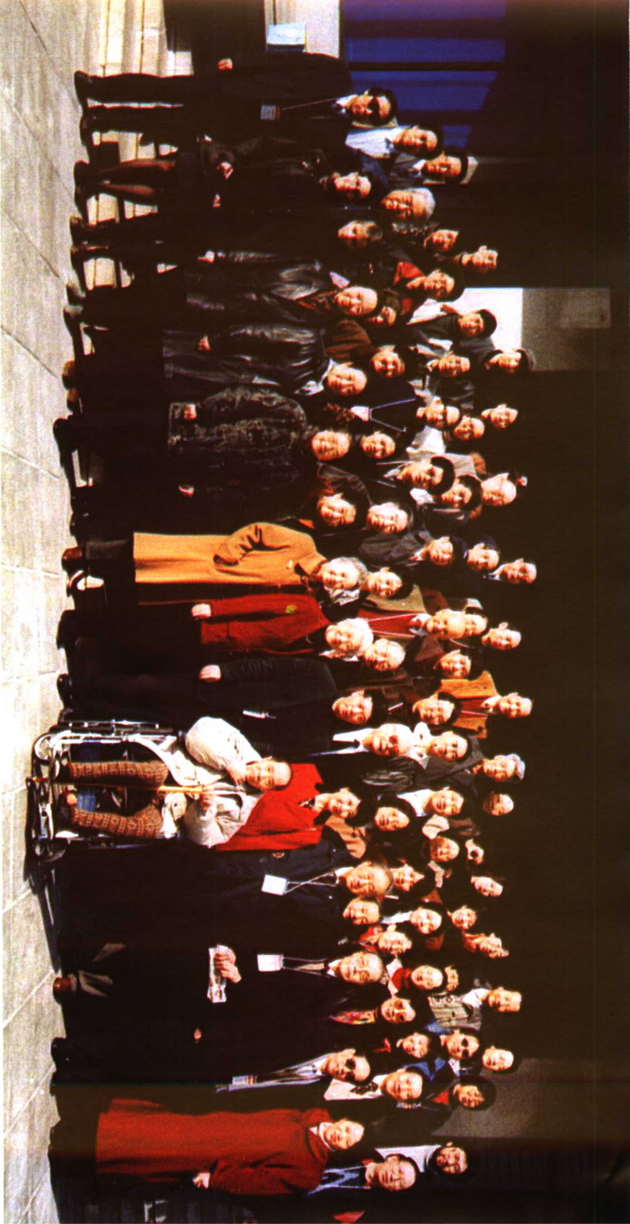
● 1997年3月，中国电影艺术研究中心、中国电影资料馆召开费穆电影研讨会，70余名电影艺术家和理论家出席了研讨会，该研讨会被《大众电影》杂志列为该年度电影界十大事件之一。这是与会全体代表开幕式后的合影。