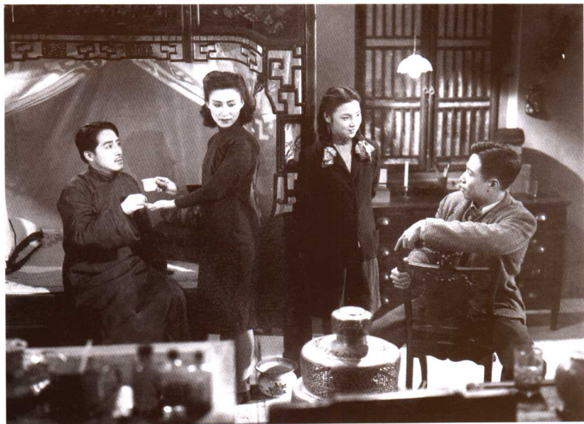
● 影片《小城之春》(1948) 剧照。