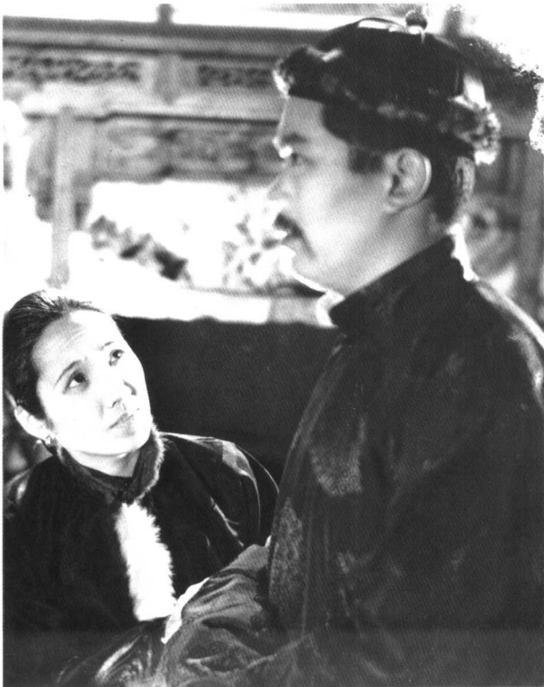
● 影片《天伦》(1935) 剧照。