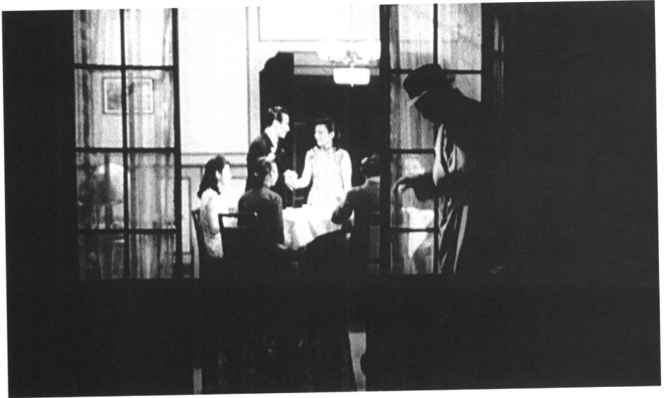
● 影片《世界儿女》(1939) 剧照。