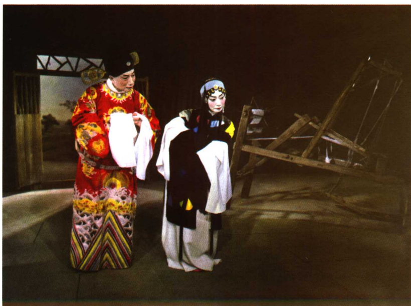
● 《生死恨》(1948) 是中国第一部彩色影片。