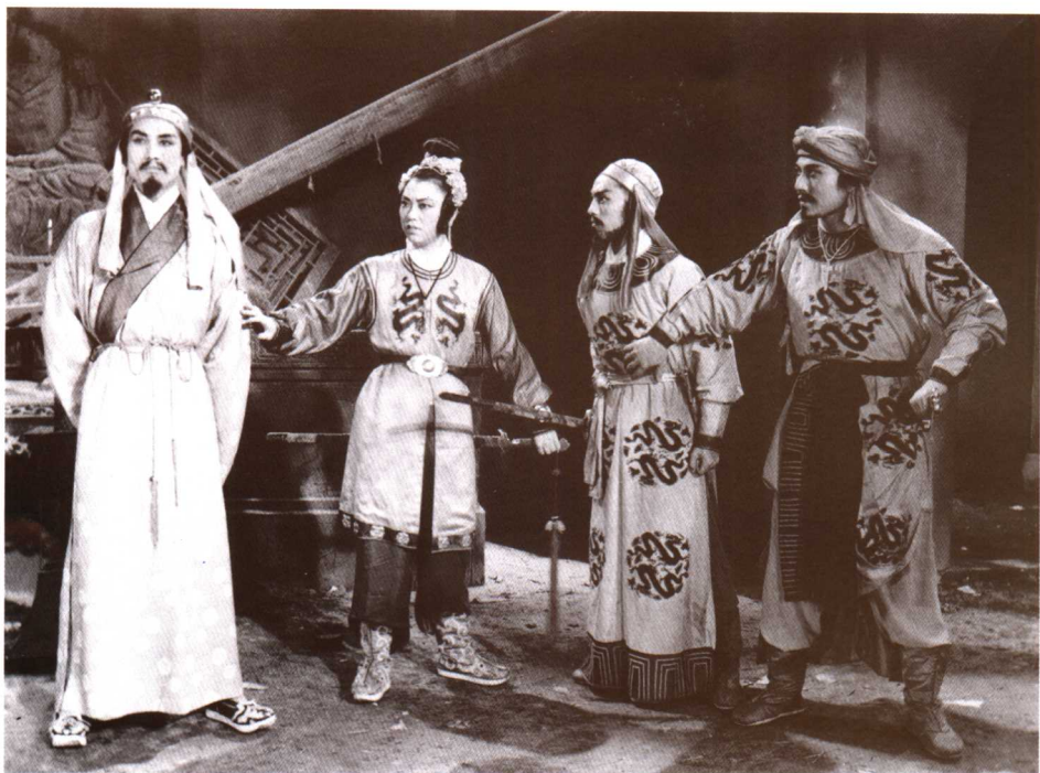
● 影片《洪宣娇》(1941) 剧照。