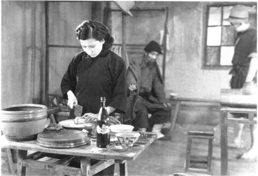
● 影片《城市之夜》(1933) 剧照。