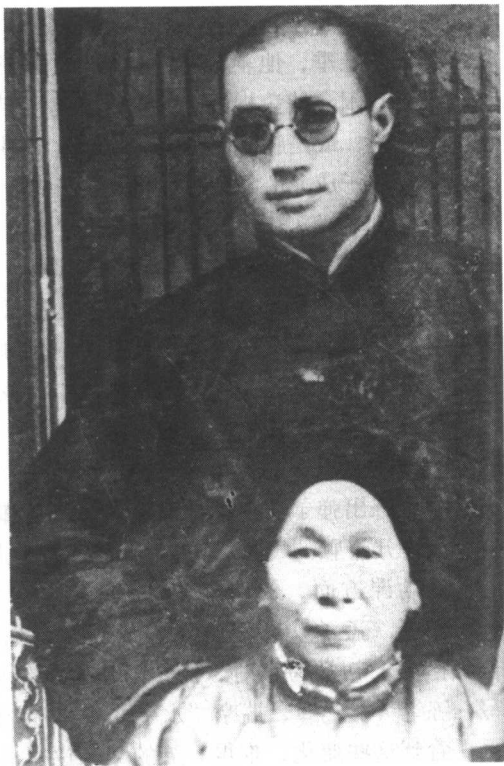
■ 20年代初期，刘伯承与母亲合影。

苦农民周源山之女，从小生长在铁峰山，身材比一般的四川婆娘要高大壮实，勤劳俭朴。川东一带的习俗，“土风坐男使女立，男当门户女出入” ① 。她长着一双没有裹住的大脚，是家庭中的主要劳力，不论是下田耕作，还是翻场、打、晒，都能摆阖得开。至于洗衣浆衫、缝缝补补，更是得心应手的事儿。她心地善良，处事严谨，忍得气，吃得亏。她虽然是么媳妇，可实际地位却在其他妯娌之上。兄弟们常议论分家，公公婆婆伤感备至，她安慰着说：“老燕衔泥朝朝累，雏燕大了各自飞。”尤其是她脑子里积攒的那些谚语、歇后语，说起来一串串的，像什么“多栽花，少栽刺”，“鸡肚哪知鸭肚事”等，常常脱口而出。幼年时的刘伯承最喜欢听母亲摆“龙门阵”，说天地古今，讲人间趣事。像孔融4岁让梨、嫦娥偷吃长生药……这些看来有些杂乱的故事，却像滴滴春雨渗入他的心田。这些，与父亲的“之乎者也”、“子曰”“诗云”之类，交口成趣，也算是苦中有乐，对刘伯承日后思想的形成和语言的发展，产生了深刻的影响。