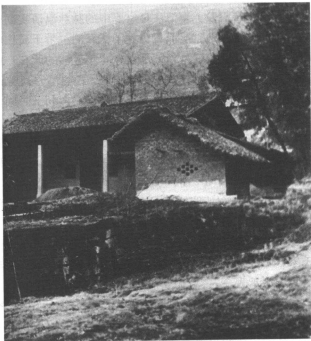
■ 刘伯承的诞生地四川开县浦里区赵家场乡张家坝

据《刘氏家谱》记载，刘家的祖籍原在湖北荆州府江陵县。后来，随着清朝初期“湖广填四川”的移民浪潮，迁到四川省云阳县关口乡定居，世代以农耕为业。到咸丰年间，刘伯承的祖父刘正富（1819—1892）因交不起租佃押金，佃不到土地耕种，被迫从长江边移向川东山区，流落到开县的浦里河畔开荒度日。刘正富体格壮健，精明强干，种田兼做铁匠。经他修理的农具及铁锅、勺铲、钳子、剪子之类，坚固耐用。他还吹得一手好唢呐，乡邻间的婚丧嫁娶少不了要请他去吹奏。多种的生活手段、广博的见闻造成了他开明通达、乐于助人的性格和比较丰富的阅历，使他很快适应新的环境，经济来源也多于一般农户。就这样，刘铁匠立住了脚跟，正式在赵家场对面的张家坝定居下来。他的六个儿子——刘文培、刘文德、刘文瑞、刘文祥、刘文吉、