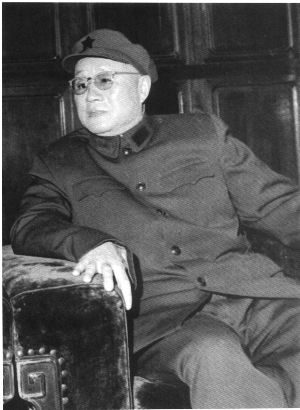
刘伯承 (孟昭瑞摄于 1966 年)