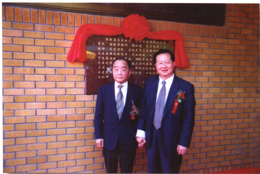
2000年5月21日，学校举行曹光彪科技楼揭牌典礼。市长张蔚文和香港永新企业有限公司董事长曹光彪为科技楼揭牌。