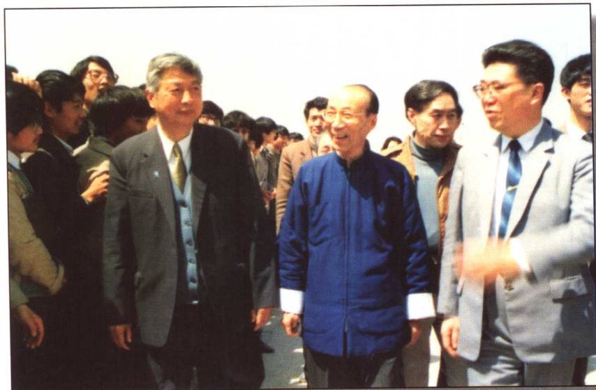
1987年4月20日，香港无线电视有限公司董事局主席、香港邵氏影业公司董事长邵逸夫一行在副省长徐起超（右二）、市长耿典华（右一）的陪同下来校访问。