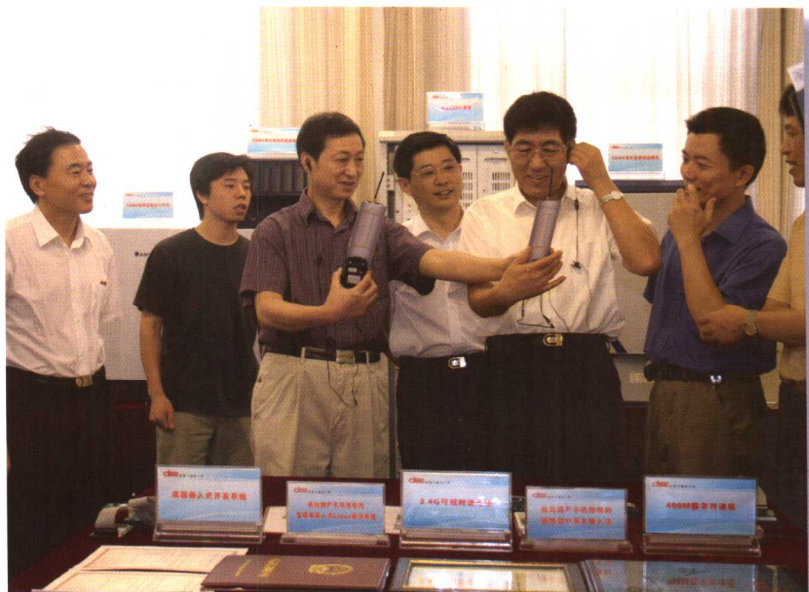
2005年9月6日，中共浙江省委常委、宁波市委书记巴音朝鲁（右三）来校慰问教师，并视察移动通信实验室。