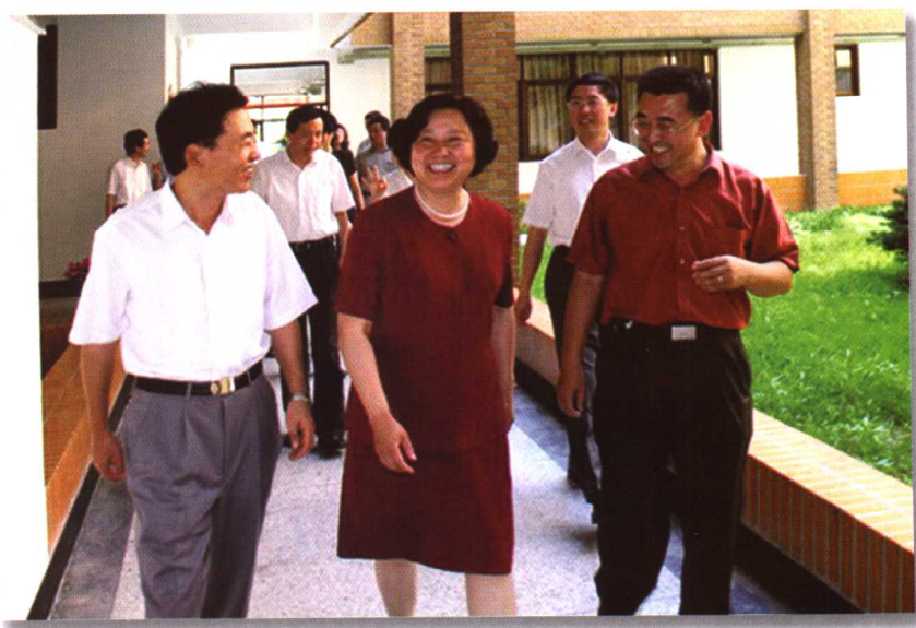
2005年6月30日，浙江省副省长盛昌黎（中）在中共宁波市委常委、宁波大学党委书记程刚（左）的陪同下检查宁波大学省“重中之重”学科建设工作。