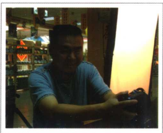
摄影：文冰 资深专业摄影师 擅长静物及空间摄影