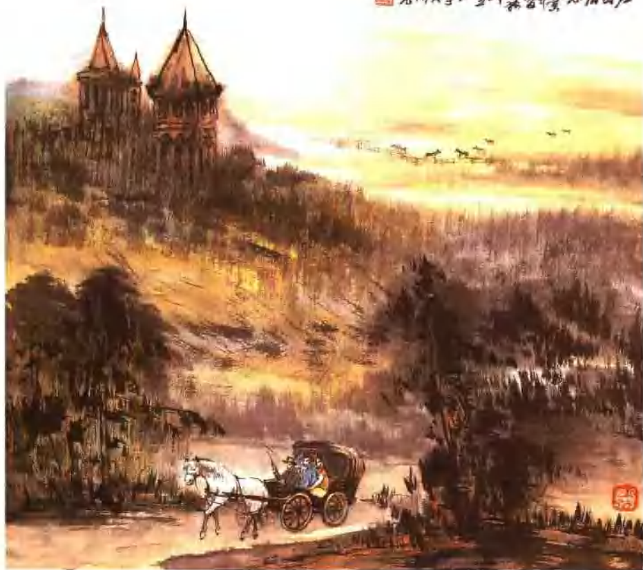
庄园春意 纵47cm 横45cm 1998年作