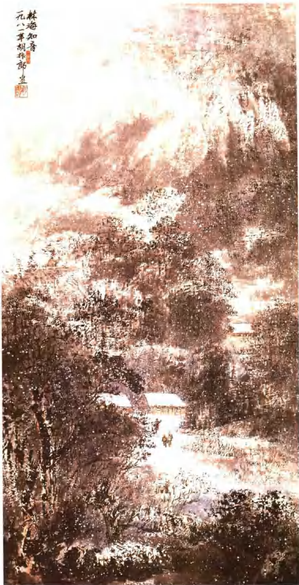
林海知音 纵 132cm 横 65cm 1981 年作 (入选 1981 年全国农垦画展)