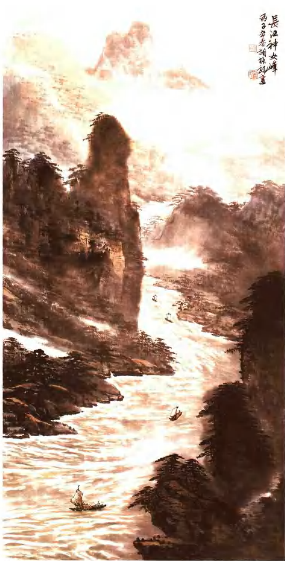
长江神女峰 纵136cm 横67cm 1996年作 (选入1996年《联征云集》第77页)