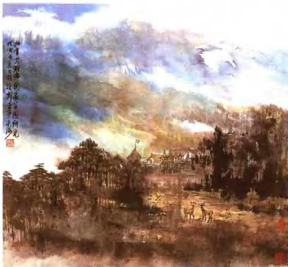
加拿大公园 纵 45cm 横 47cm 1998 年作