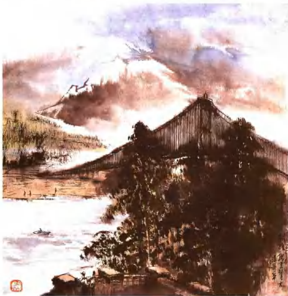
加拿大温哥华 纵47cm 横45cm 1998年作