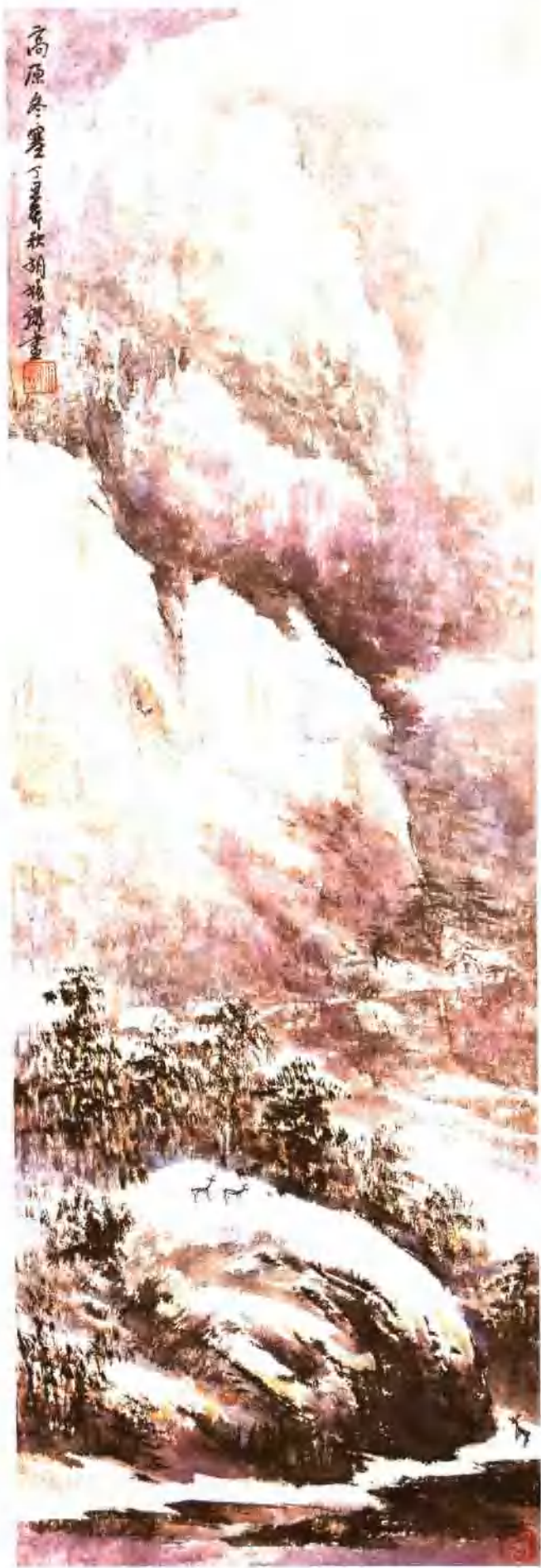
高原冬寒 纵 90cm 横 30cm 1998 年作