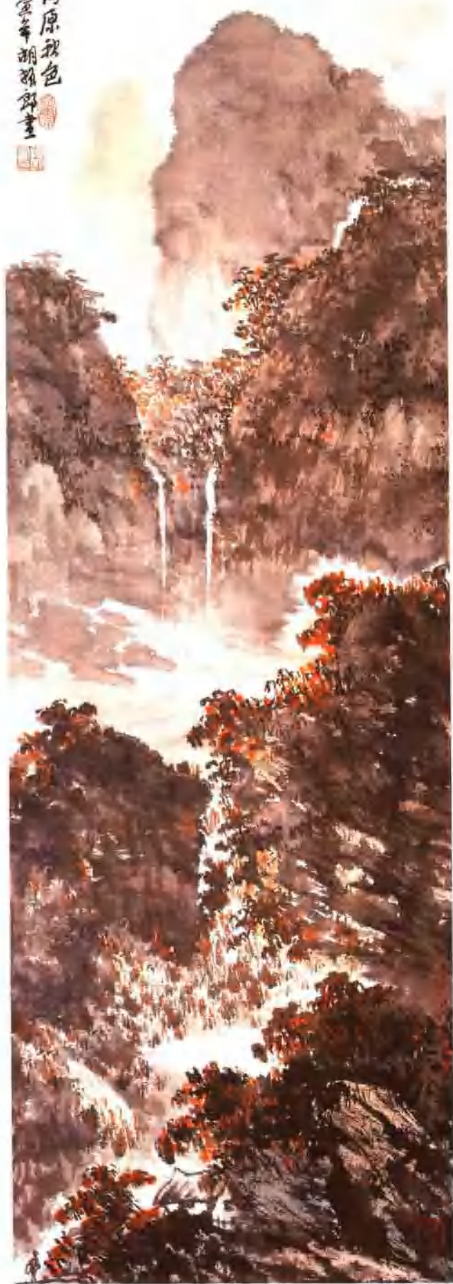
高原秋色 纵 90cm 横 30cm 1998 年作