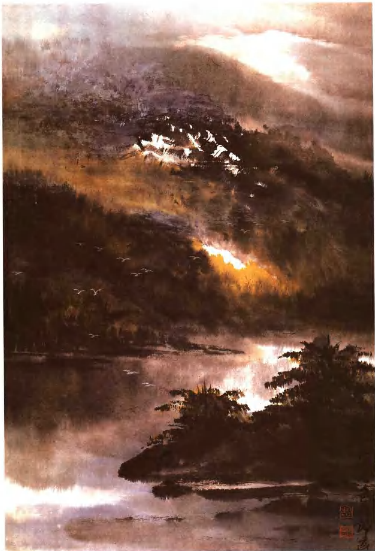
山村暮色 纵67cm 横44cm 1992年作