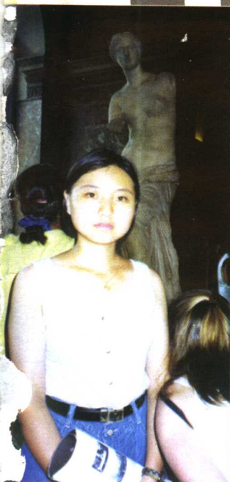
在卢浮宫维纳斯雕像前