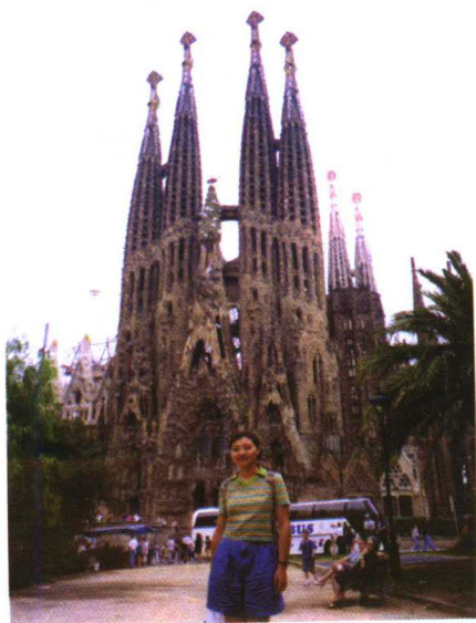
巴塞罗那 盛世家族大教堂