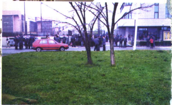
中国大使馆组织侨民撤退