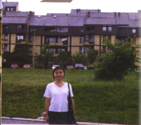
在贝尔格莱德52路总站