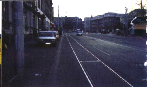
北约空袭后的贝尔格莱德