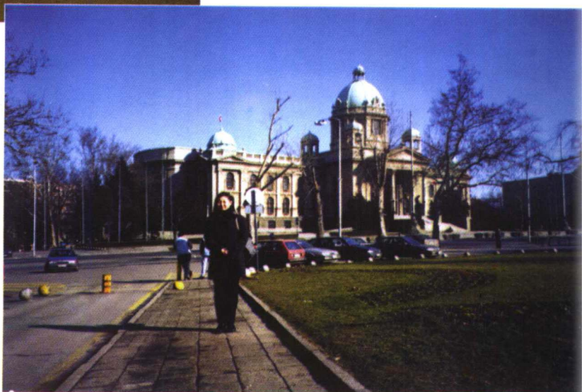
贝尔格莱德议会大厦