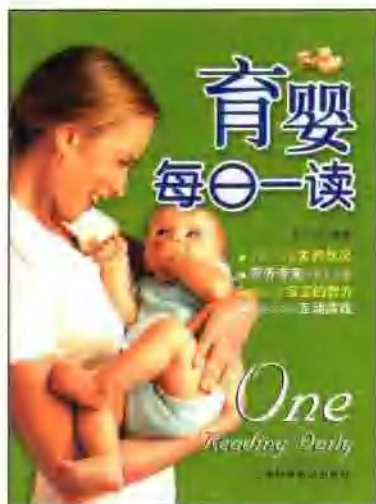
育婴每日一读 定价:29.80元