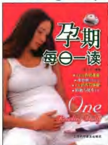
孕期每日一读 定价:29.80元