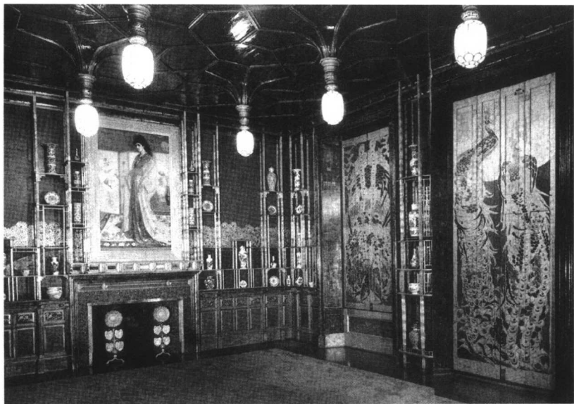
一个美国青年继承了一座奇怪的豪华巨宅。

2002年9月初，“911”之前，美国NBC电视台播放了一个电视短剧《阴影》(Shadow)。讲的是一个美国青年的离奇故事，他意外地继承了家族的一座奇怪的豪华巨宅，这座巨宅有个“怪癖”，每到晚上，这个巨宅必须灯火通明，任何一个角落都必须有灯光，否则就会有阴影来侵袭害人。