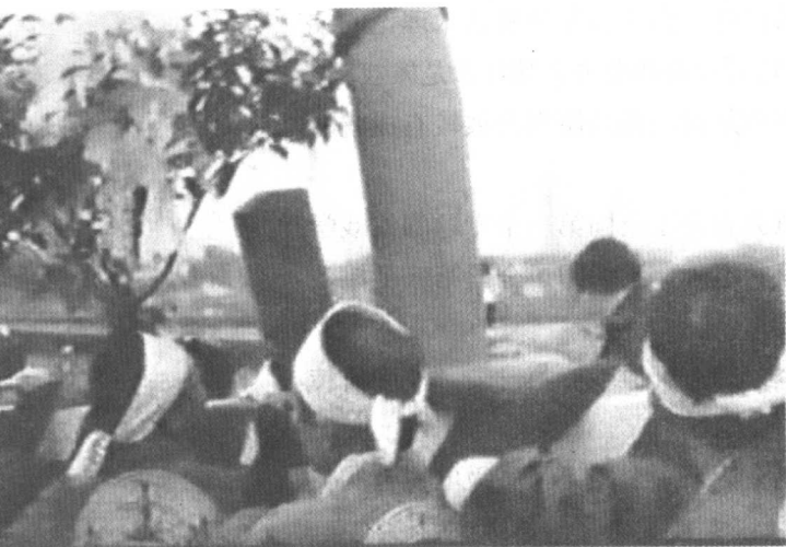
令人震惊的 日本傩祭

豁然开阔。在运用文化人类学理论的同时，我兼容了对傩的学习收获。这样，戏剧的研究与傩的研究互为因果，相得益彰。