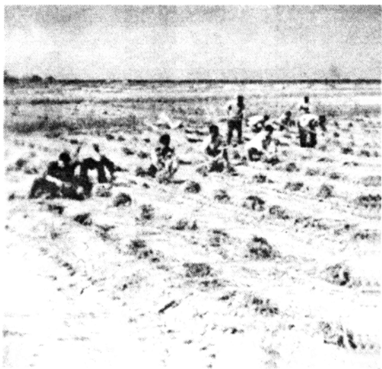
一九六八年秋收〔捆稻子〕，左起第四人为作者