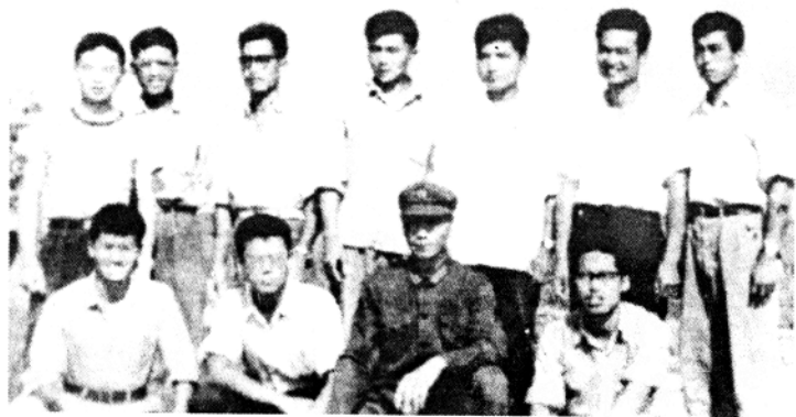
“再教育”全班合照，后排左起第三人为作者