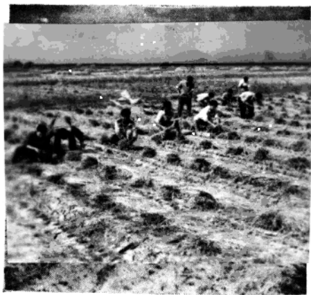
1968年 草泊农场 秋收“捆稻 子”左起第 四人是朱 陈勋、左 上角远景 为住处。