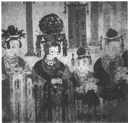
敦煌61窟壁画：（五代）女供养人像

北方原有唐朝留下来的许多藩镇，河东的李克用就是其中之一。残唐和后梁时，朱温（后梁太祖）一直同李克用父子对峙。朱、李两家与河北的旧藩镇时和时战，几个旧藩镇时而亲朱，时而亲李，关系极其复杂。朱温称帝的时候，旧藩镇多数已被两家并吞，然而幽沧（幽州和沧州）的燕（刘仁恭父子）和陕西凤翔一带的岐（李茂贞）仍旧保持着独立的地位。他们的实力比南方某些国家强得多，但是都没有算到十国里去。