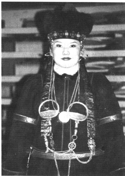
布里亚特蒙古女服