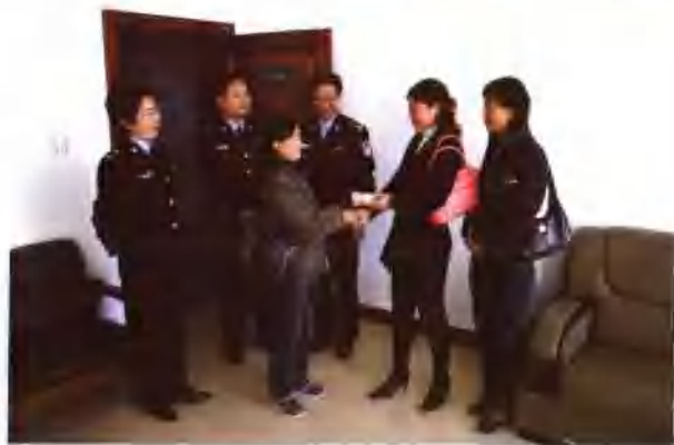
◀ 在执行法官的努力下，当事人达成了执行和解协议，并当场履行。