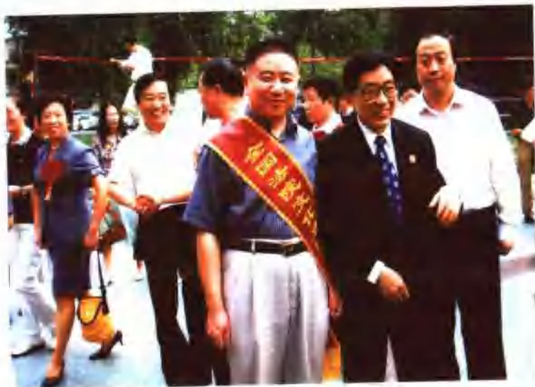
▲ 2006年9月，全国法院文化建设先进单位表彰会在鄂召开。院长龙呈德代表大庆市龙凤区人民法院受奖，并与最高人民法院大法官、审判委员会委员刘家琛合影留念。