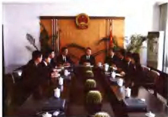
▶ 黑龙江省大庆市龙凤区人民法院班子成员正在研究调解工作。