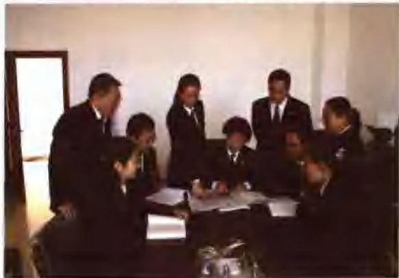
▶ 黑龙江省大庆市龙凤区人民法院专门成立调解课题研究小组负责《基层法院调解艺术》书籍的编辑整理工作。