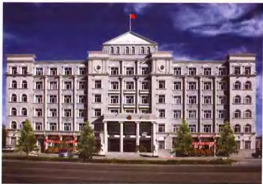
龙凤区法院审判办公综合楼