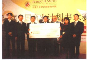
中国商业计划书大赛冠军团队