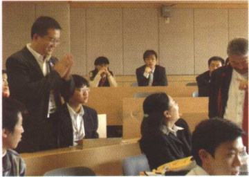
在韩国科学技术院(KAIST)访问