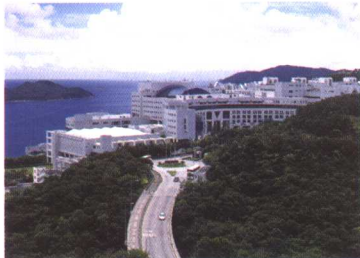
依山傍海的香港科技大学