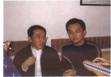
采访著名作家海岩