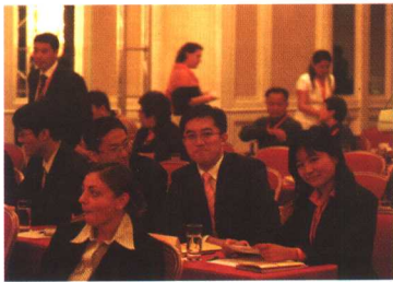
与创业伙伴在中国商业计划书大赛决赛现场