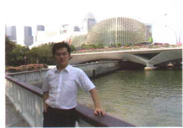
在新加坡参加国际会议