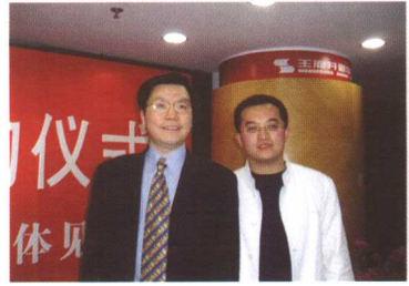
与GOOGLE中国区总裁李开复博士合影