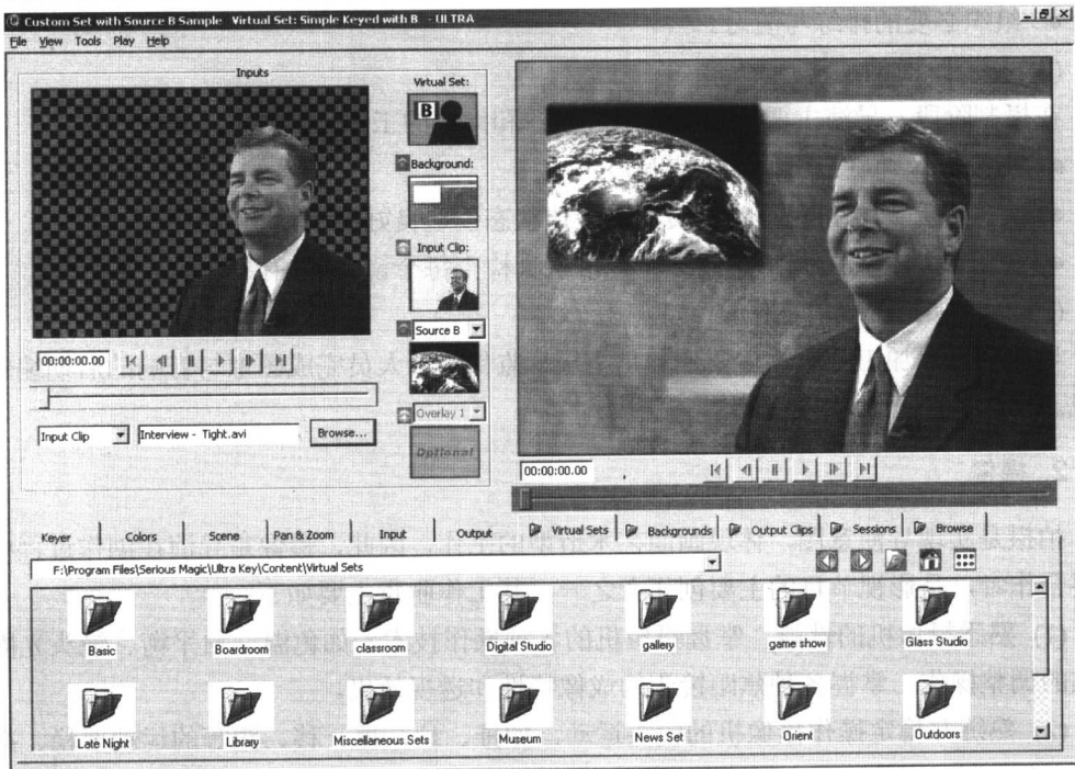
图 1-6 纯软件虚拟演播室系统

虚拟演播室可以分为两种类型:一是软、硬件结合的虚拟演播室系统;二是纯软件虚拟演播室系统,如图1-6所示。