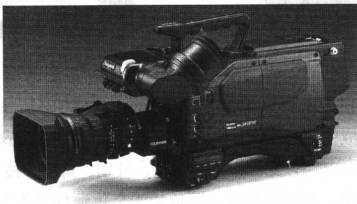
图 1-1 便携式摄像设备

ENG, 即电子新闻采集(Electronic News Gathering)。这种方式是使用便携式的摄像、录像设备来采集电视新闻, 因此能适应新闻采访的运动和灵活性、新闻事件的突发性、电视报道的时效性和现场性。便携式摄像设备如图 1-1 所示。