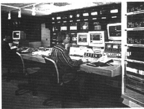
图 1-4 演播控制室

ESP，即电视演播室制作(Electronic Studio Production)，主要是指演播室录像制作，也包括演播室直播。因为演播室设备的不断现代化，增强了演播室制作方式的适应能力。例如，室内灯光系统的全自动化，高清晰度的广播级摄像机系统，高保真音响系统，特别是数字特技、模拟特技、动画特技系统，它们组成了一个高科技制作系统。图 1-4 所示的是演播控制室，图 1-5 所示的是演播室摄像机。