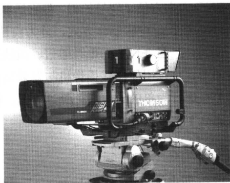
图 1-5 演播室摄像机

ESP 既可以先摄录，后编辑；也可即摄、即播、即录。因此，它应当成为电视台自办节目的主要手段。