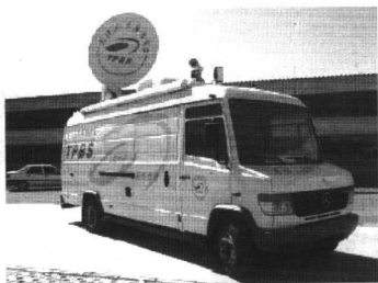
图 1-2 电视转播车