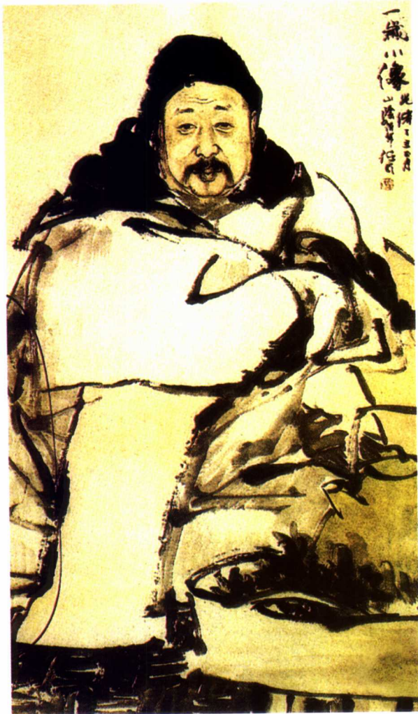
何以诚肖像 任伯年 公元1880年

远，人景交融，又能浑然而成一体。所以从整体上来说，明代绘画在我国人物绘画发展史上具有深远的影响，其中影响较大的画家有唐寅、仇英、吴伟、戴进、蓝瑛、徐渭、陈洪绶等。其中陈洪绶的人物画更具创造性，他的作品以工笔为主，也画工写相间的作品。他在人物画造型方面自成面貌，奇拙古朴，用笔浑厚而含蓄，具有很强的装饰性和怪诞之美。至为时人称绝。对水墨人物画的发展影响较大，在中国人物画历史上占有重要的位置。