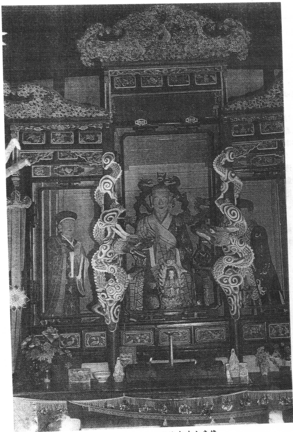
云南武定县狮子山正续寺建文帝像