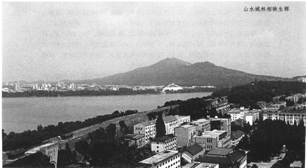
山水城林相映生辉

南京的山，给人以阳刚浑厚之感；南京的水，给人以阴柔灵秀之气；南京的城，更是天人合一的杰作；南京的林，在世界上享有“绿城”之誉。山水城林巧集一地，古今辉映。相传在三国时期，诸葛亮即赞誉南京“钟山龙盘，石头虎踞，此乃帝王之宅也”。至近代，孙中山先生赞美道：“南京为中国古都，在北京之前，而其位置乃在一美善之地区。其地有高山，有深水，有平原，此三种天工，钟毓一处，在世界中之大都市诚难觅此佳境也。……南京将来之发达，未可限量也。”