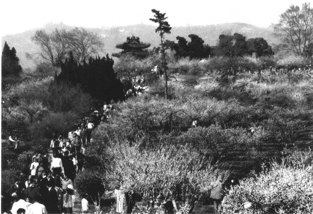
初春时节，人们穿行于梅花山花海之中

1993年在观梅轩西侧又落成一座高大典雅的博爱阁。在梅花山的东侧，为了纪念我国历史上著名的文学家曹雪芹，由中山陵园管理局于1997年春筹资建造了“红楼艺文苑”主题公园。公园占地面积7万多平方米，是一座写意山水园林。它以《红楼梦》为蓝本，选取其精彩章回作为园中的11个意境单元，通过植物、雕塑及各种建筑小品，展现《红楼梦》中精彩章回的意境，营造其艺术氛围，揭示其文化内涵。