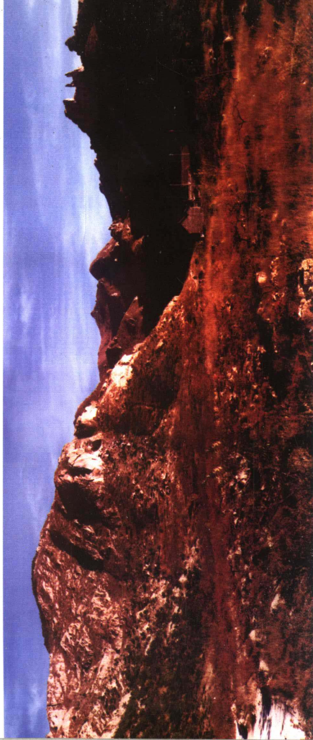
沐浴斜辉里（大虹螺山）