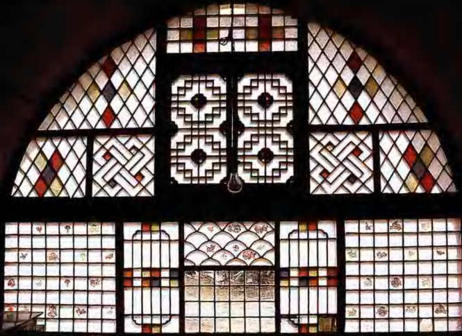
圖上窗上的剪紙窗格——感此，它的門窗連格一體，有窗了雙喜的窗格字，雙喜的，財源旺，福祿壽，福壽祿壽正福壽，雙喜雙福于我北。

面對富含東方審美意趣的民間剪紙遺珍，就連八旬老人也祇記得是“老人傳下來的花樣”。其暗示的歷史線索，指向一個剛剛過去的光華燦爛的剪紙藝術時代。在那個時代裏，聰慧的中國民間婦女用自己靈巧的手為人類文化築起了一座奇偉的高峯。本卷力圖登頂集珍，所集者，或許僅是高峯之巔的一塊石、一捧雪、一朵雪蓮。