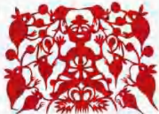
《五福临门之喜鹊“空巢”》 播种多子。