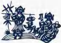
梁祝過河 表現十八相送，一別過河，女背男渡河， 男英雄壯烈犧牲，女悲痛的哭臉。 柳家樂 畫。