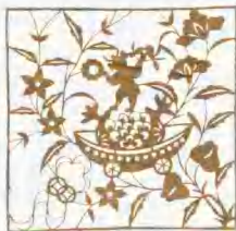
《“葡萄红了”播种多子》。

求子 子嗣不断、家族绵延是一个家庭最重要的大事，生了孩子，特别是生了男孩，妇女在家庭中拥有地位，所谓：“有子且迎天，无子着海星。”因此，生子是妇女婚嫁最大的心愿，表达求子心愿也成为民间剪纸最常见的题材。祈求神童赐子的如“天妃送子”、“麒麟送子”，希望子女成群的如“老鼠偷葡萄”（鼠喻子——“子鼠”，葡萄喻多）、“连（莲）生贵子”、“榴开百子”、“百子图”。