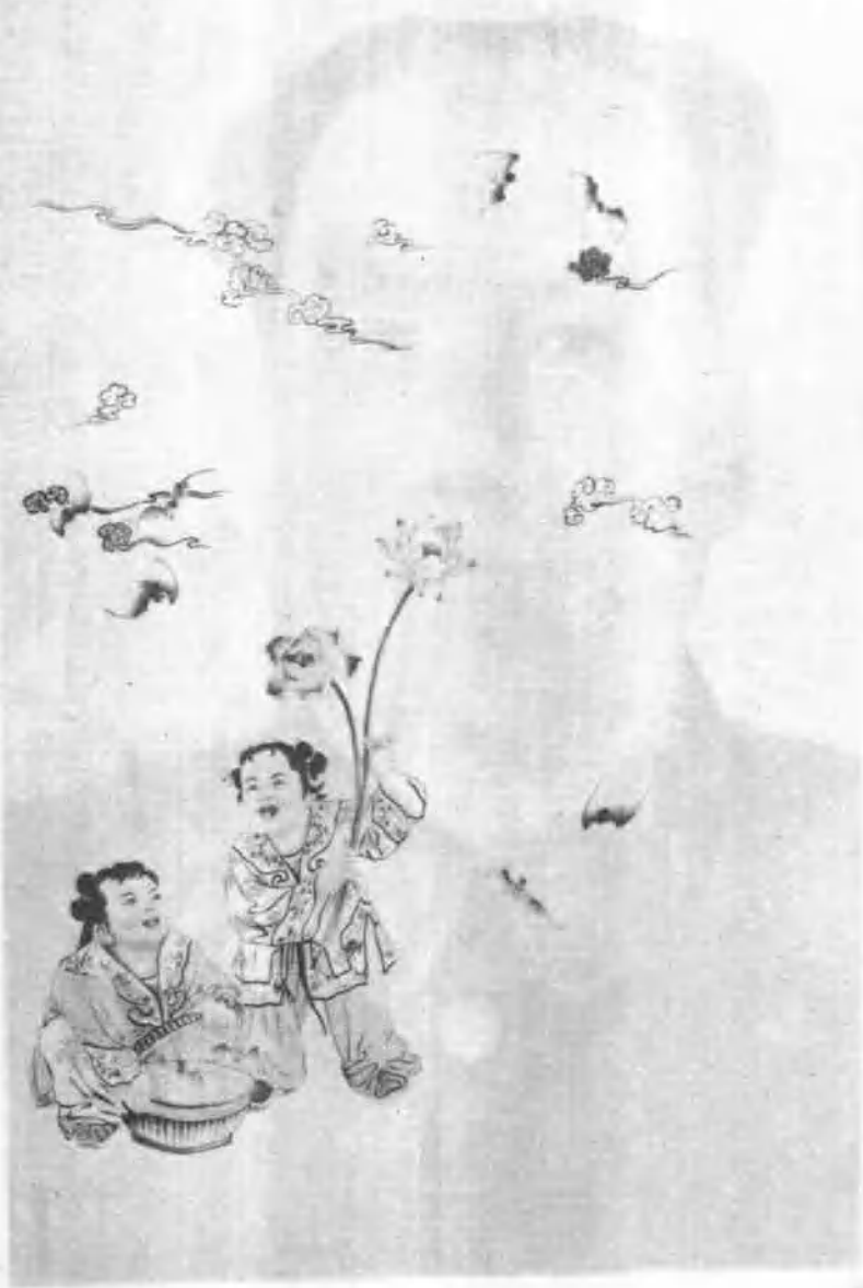
2 和合被面 长沙市湘绣社