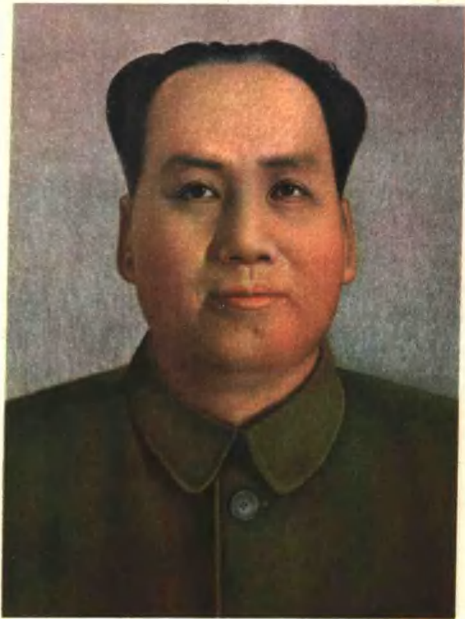
1 毛主席像 省油漆厂陶玉珍