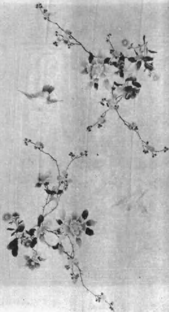
8 折枝花鸟 长沙市湘绣社