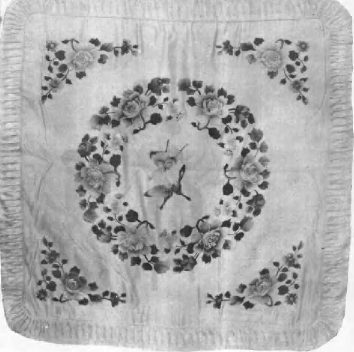
4 靠 垫 (李秉昆画)长沙市湘绣社