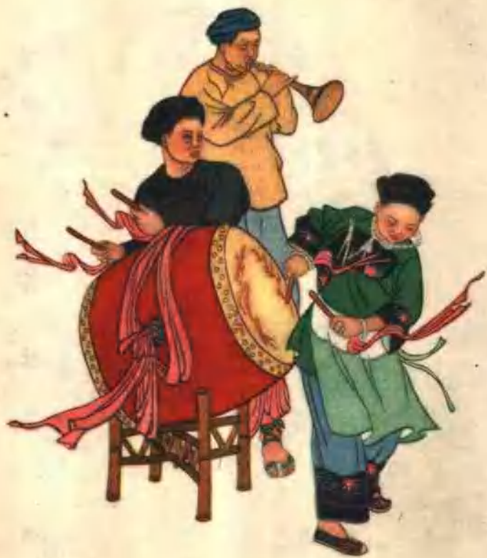
3 猴 儿 鼓 (陈白一画) 湖南省湘绣厂