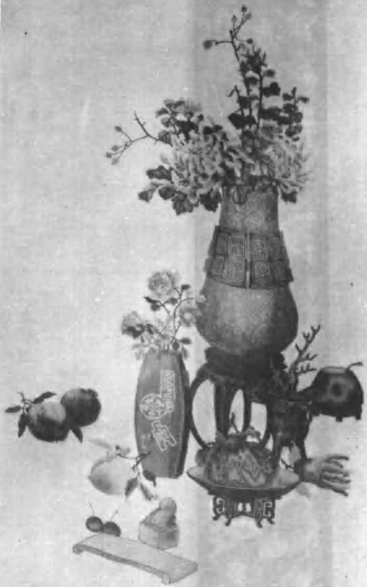
10 博古图 (二面绣) (李凯云画) 湖南省湘绣厂