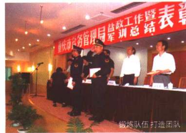
锻炼队伍 打造团队