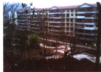
经开区农转非人员安置房与休闲公园交相辉映