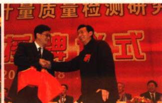
政协副主席尹明善授印