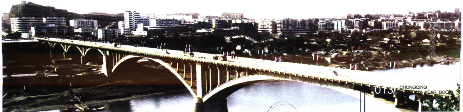
潼南新城建设实景图