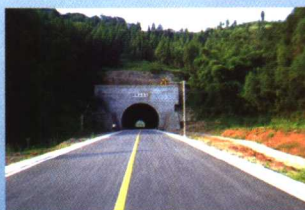
四通八达的“一小时潼南”工程

如今的潼南交通建设逐渐走上了与经济社会协调发展的良性循环的道路。全县公路总里程达1526.66公里，硬化油化的公路里程达360公里，初步形成以渝遂快速铁路、渝遂高速公路、国道319线横贯东西，以省道205线、王兴公路纵接南北，以水上运输和农村公路为补充的三横二纵一补的大交通网络。