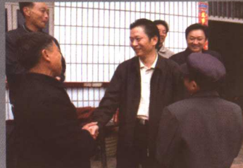
县长王昌伦亲切慰问困难群众

(三)加强财会人员队伍建设。2005年,组建了潼南县会计管理中心,列入了依照国家公务员管理的事业单位。