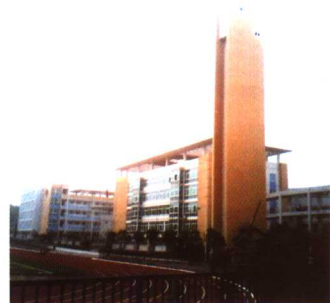
经开区现代化的学校