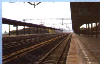
快速铁路贯通全县