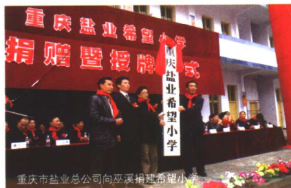
重庆市盐业总公司向巫溪捐建希望小学