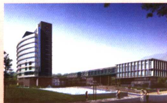
建设中的计量质量检测研究院大楼