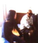
经开区礼家镇党委书记(左)亲切慰问敬老院孤寡老人