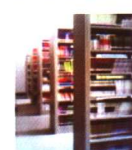
经开区投巨资打造的中学图书馆