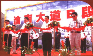
市领导为渝南大道B段剪彩