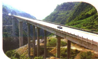
319国道彭水郁山特大桥