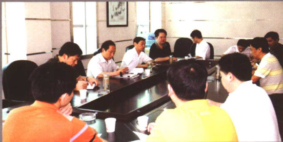
县委书记向和平到财政局指导工作