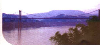
忠县长江公路大桥