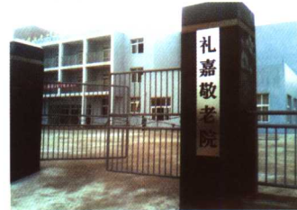
经开区投巨资打造的敬老院