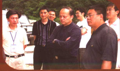
市党委书记刘崇伟到奉节检查工作