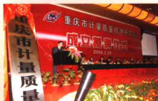
周慕冰副市长讲话

国家客车质量监督检验中心建筑面积8920 m 2 ，为中国实验室认可委（CNAL）认可实验室；国家发改委授权的汽车新产品公告检测机构；国家认监委授权的汽车新产品强制认证（3C）检测机构；国家环保总局授权的机动车排放检测机构。