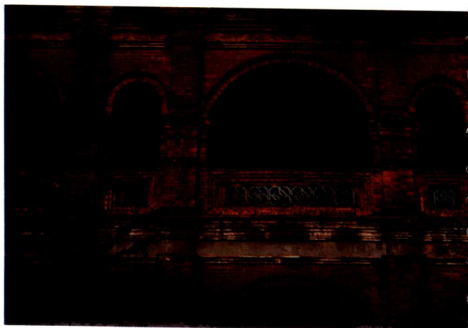
▶大稻埕港邊之洋樓，欄杆嵌入琉璃花磚，顯然為中西混合式作法。

其次，外商在居留地或租借地所建的洋行或大宅邸亦呈現同樣的殖民地樣式之特色，中國文獻稱之為「夷館」。較著名的洋行如：淡水順寶洋行 (John Dodd)、安平英商德記洋行 (Tait & Co.)、英商和記洋行 (Boyd & Co.)、德商東興