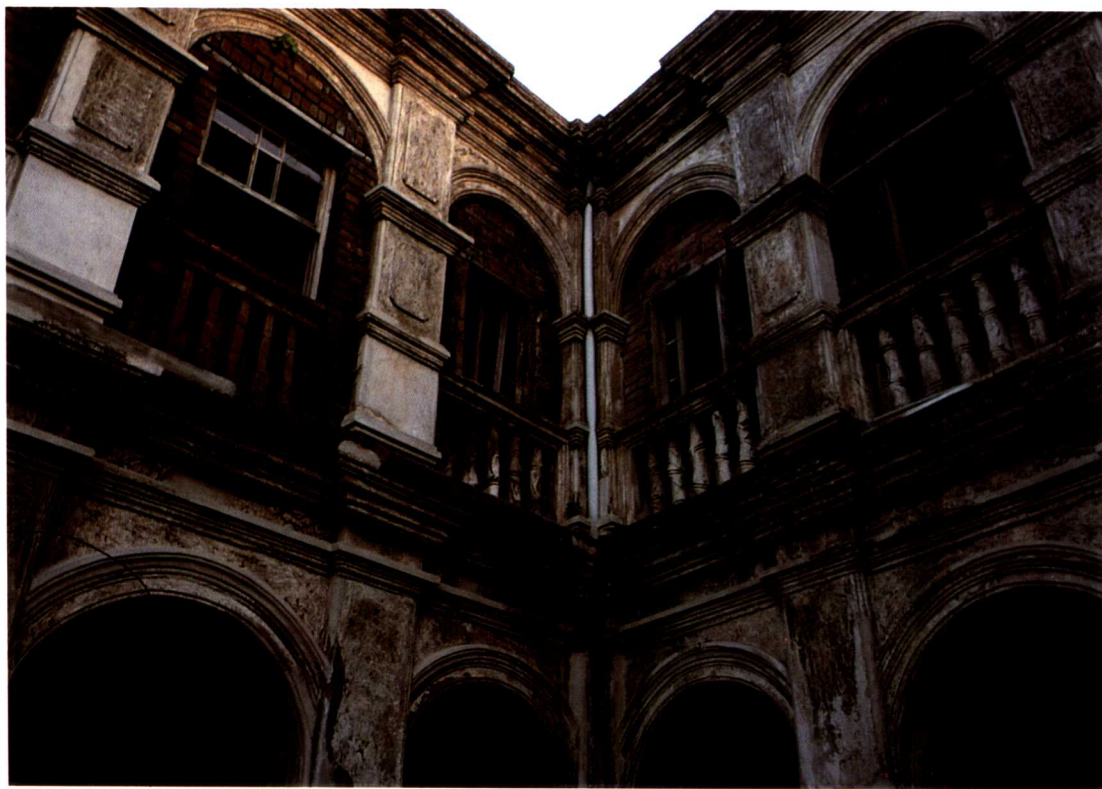
▲ 淡水的白樓，牆體內為磚砌，外表粉白灰故得名。