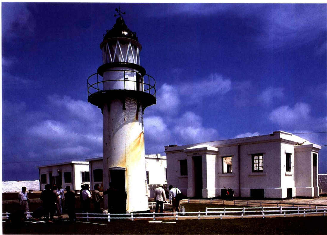
▲1874年向英國David M. Henderson 廠所購的澎湖西嶼燈塔。