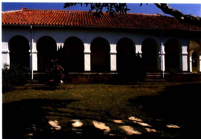
◀淡水的總稅務司署為清末留下來之完整洋樓之一。