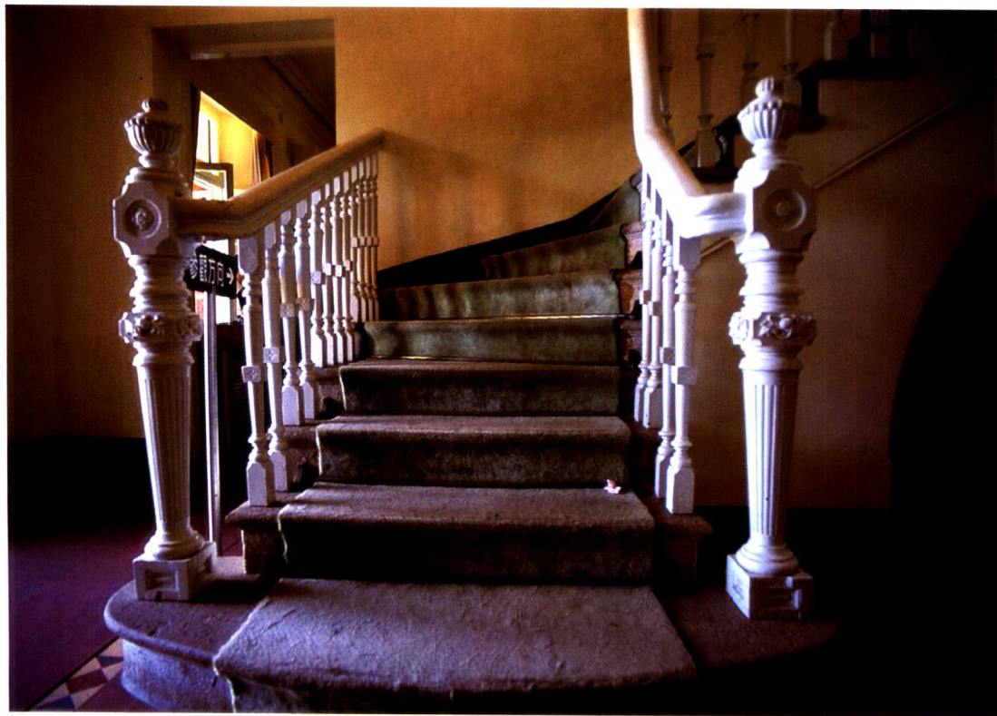
▲ 淡水英國領事館木彫欄杆之樓梯為維多利亞時期風格。