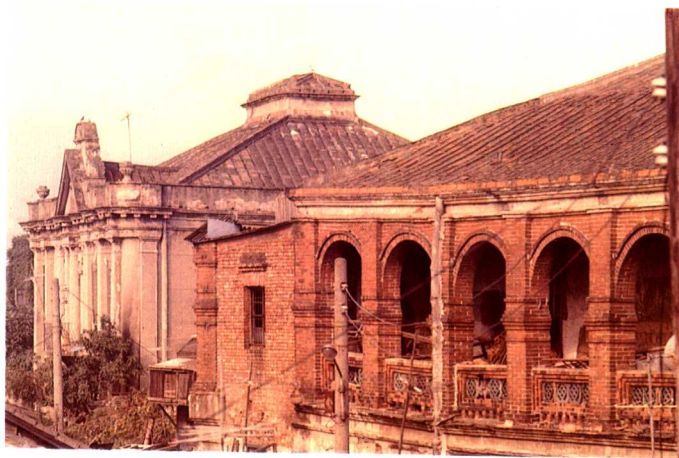
▲台北大稻埕淡水河邊之洋行，現已拆除殆盡。此圖攝於1970年。

台灣在洋務運動時所接觸的西洋國家主要爲英國、德國、法國三國，其次才是荷蘭、意大利、美國、加