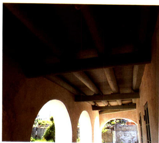
▲安平德記洋行之樓板使用木樑構造。