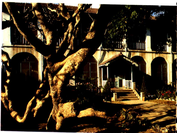
▶台南神學院之拱廊式教堂。