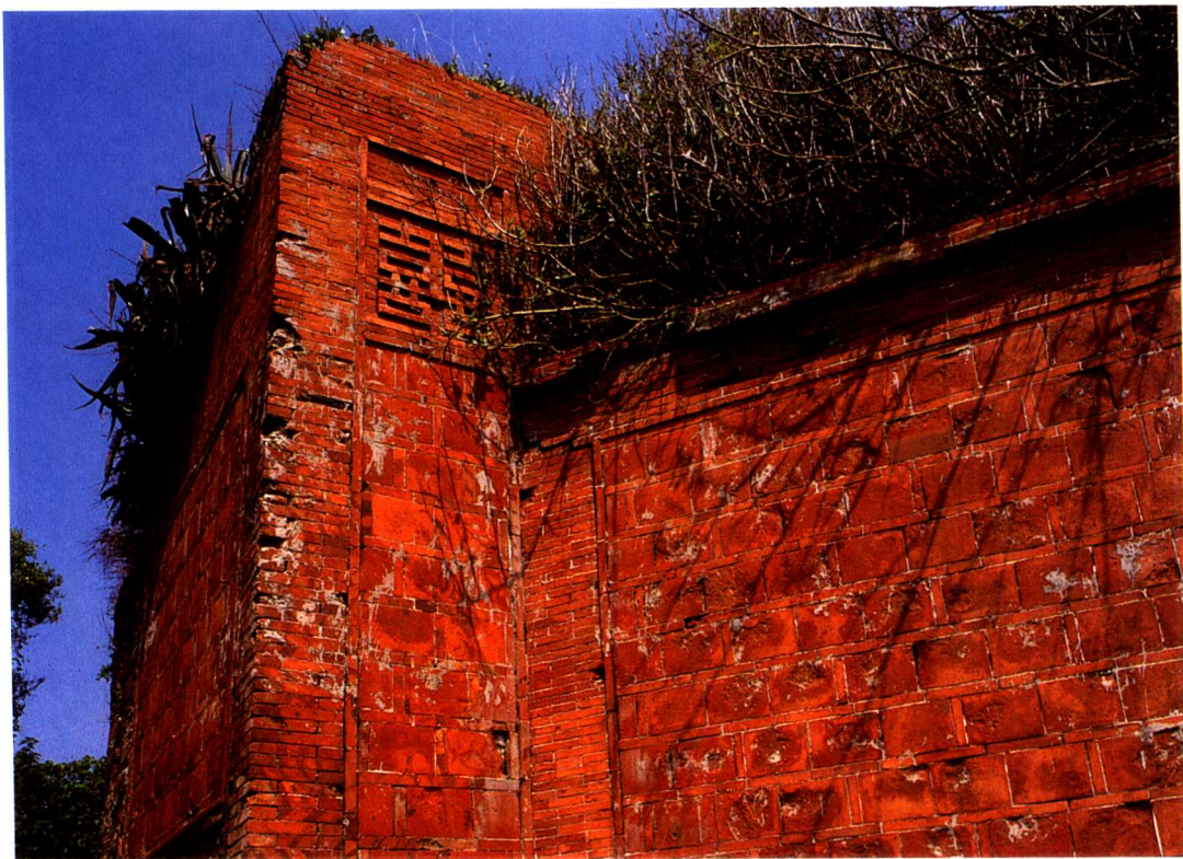
▲高雄旗后礮台之入口門柱上以紅磚砌出「囍」字樣。