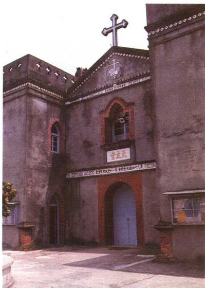
◀ 建於1870年的屏東萬金天主教堂為目前台灣僅存之清代天主教堂，其入口風格融合了地方傳統與西班牙教堂之特色。