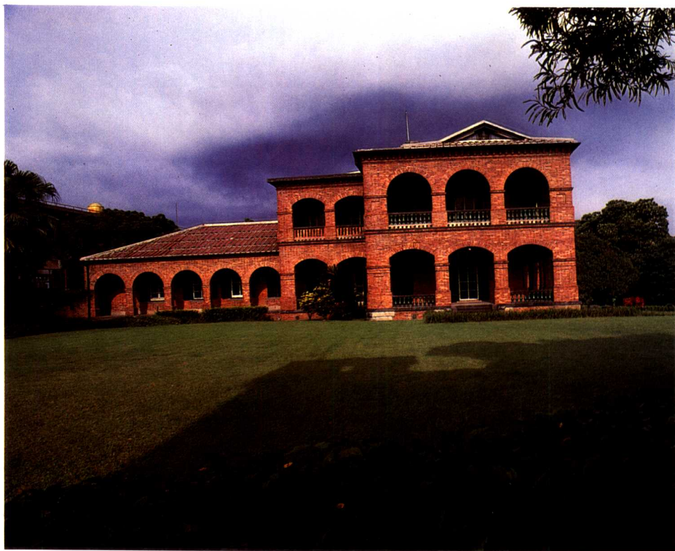
►建於1891—1905年的淡水英國領事館，磚工精緻罕見