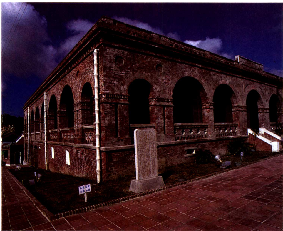
►建於1864—1877年之間的打狗英國領事館，厚實之外牆與拱廊為當時殖民樣式特徵之一。