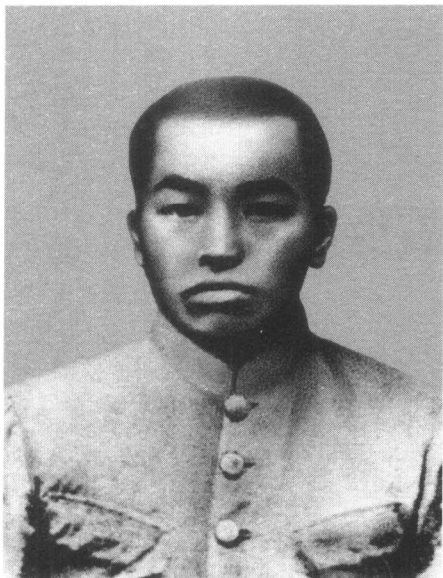
■ 青少年时期的彭德怀

道日衰，只有八九亩荒土地，山地种棕、茶、杉和毛竹，平地种红薯、棉花。全家六口：祖母、父亲、母亲、姐姐（两年后夭折）和彭得华，还有鳏居的伯祖父同他们一起生活，勉强维持温饱。