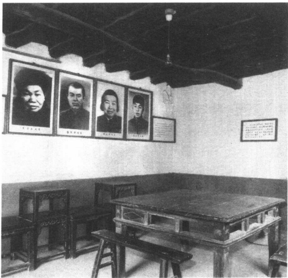
■ 修复后的彭德怀故居一角

两年中，家里先后卖掉山林树木和荒坡，几间茅屋只留下两间栖身，其余全部典押出去，最后，连围子里的树根都挖出卖掉。秋收后，穷苦人为生计所迫，到富户家门口，摆上几个小碟，里面放些干果之类，说上一些吉祥话，不开口讨要，由