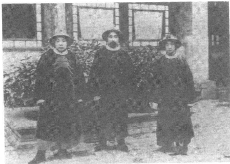
徐世昌(中)与毓朗(右)、赵秉钧(左)

大醒的主意果然好。一个月下来，看画和住宿两项收入加起来，足足有一百五十两银子，几乎为半年的香火钱。同时，这个