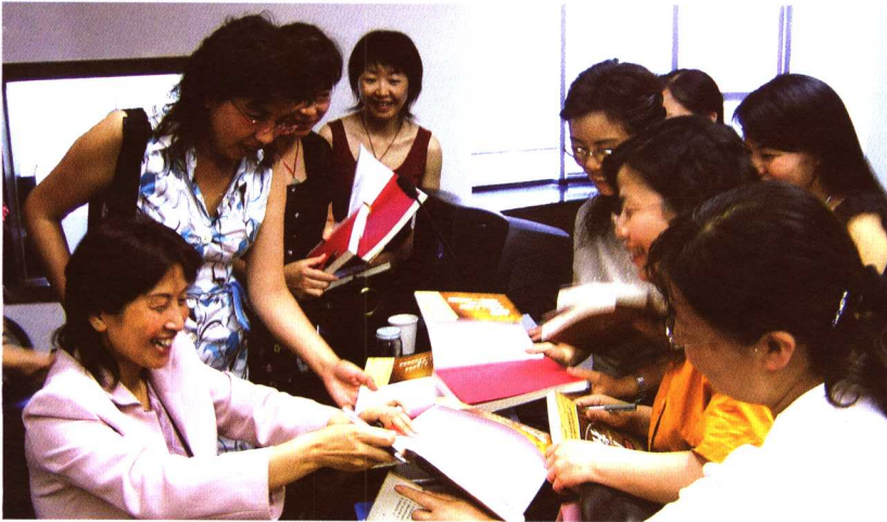
□ 作者在中国银行厦门分行举办培训并签名售书