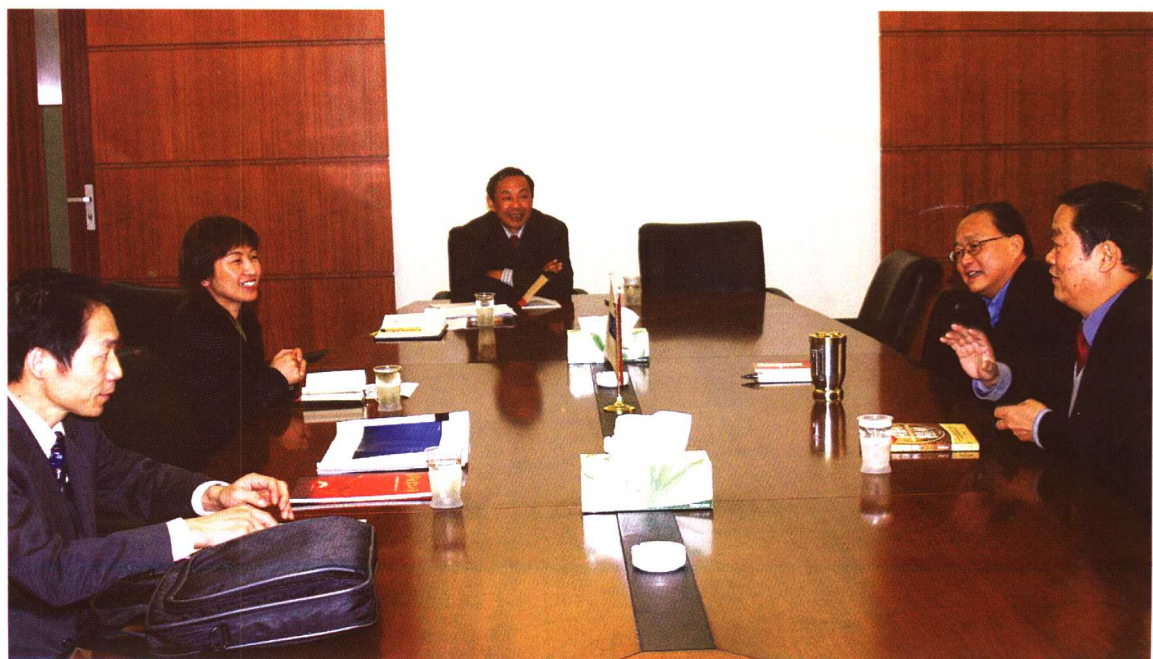
作者在中建八局培训时与八局领导会谈