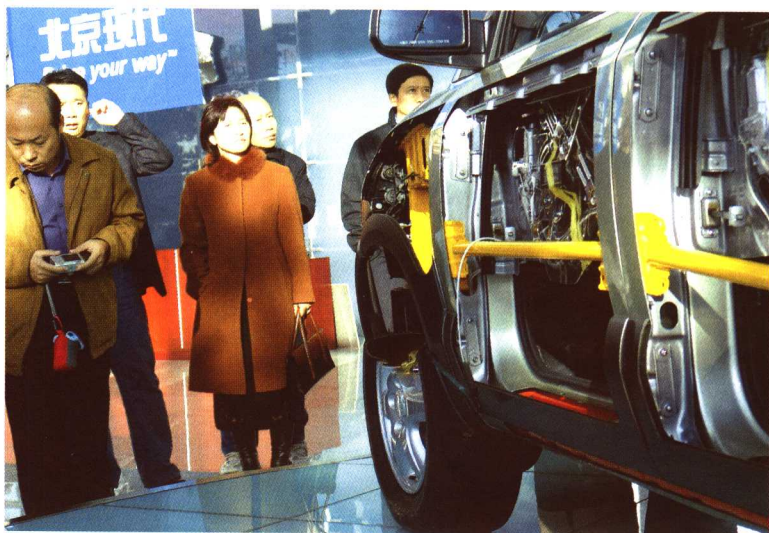
□ 作者在北京现代 培训研讨