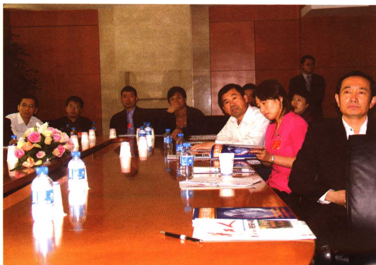
□ 作者在华为集团培训研讨