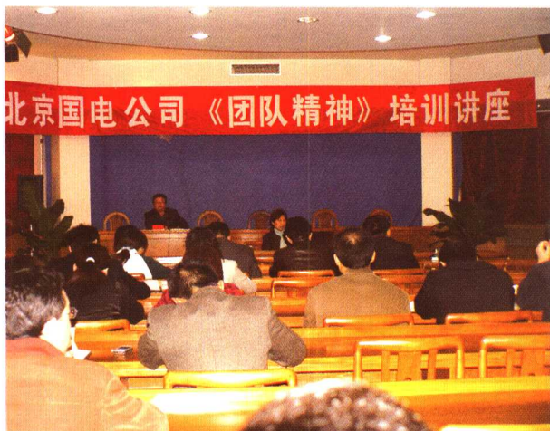
□ 作者在北京国电公司举办培训