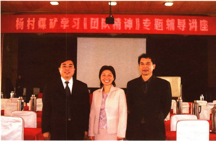
作者在杨村煤矿 举办培训