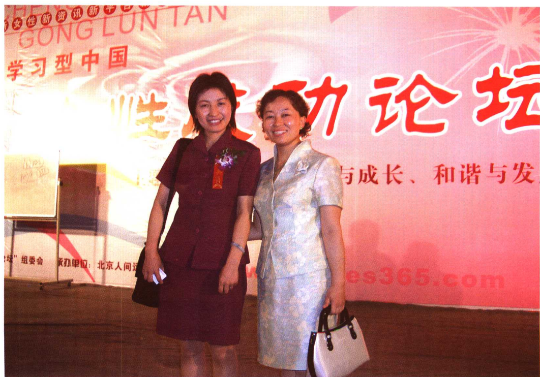
作者在北京大学授课演讲