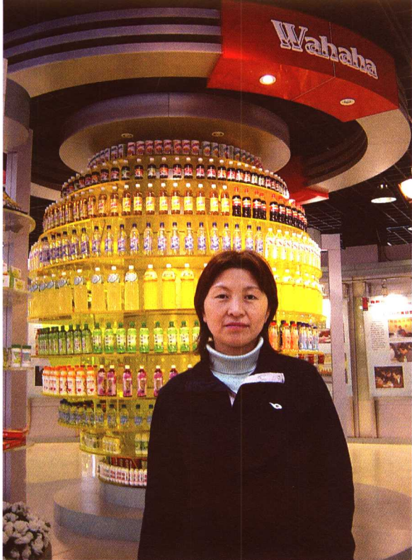
作者在娃哈哈集团考察培训