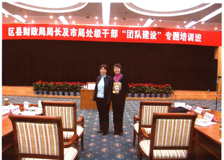
□ 作者在北京市财政局举办培训