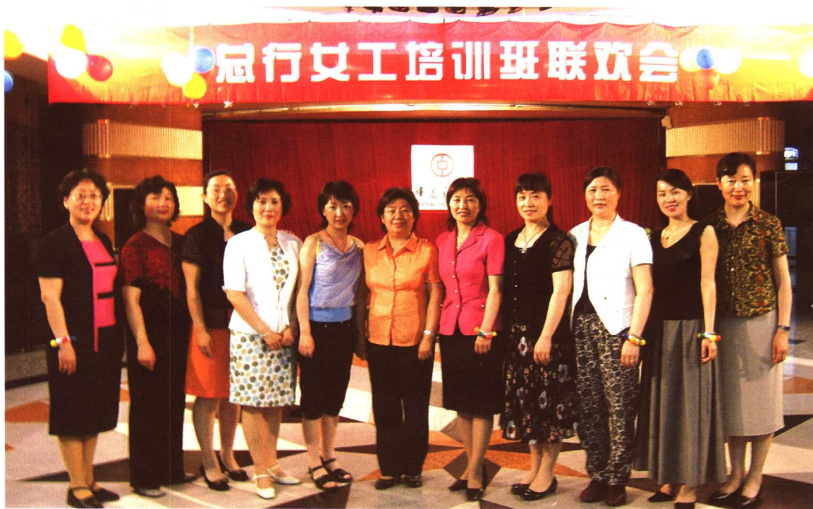
作者在中国银行总行举办培训