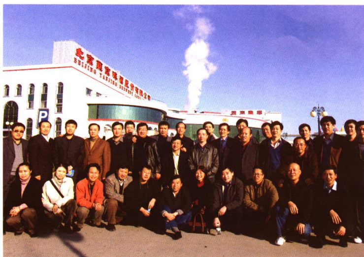
□ 作者在北京燕京啤酒集团举办培训