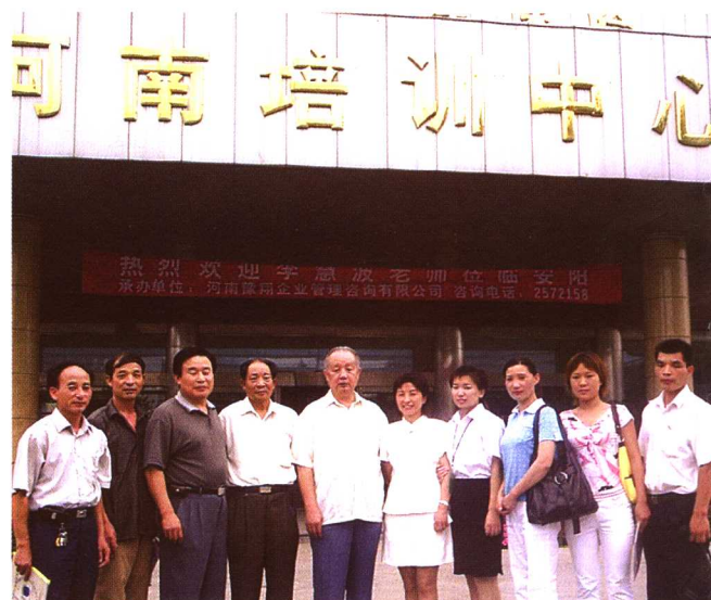
作者在河南举办培训