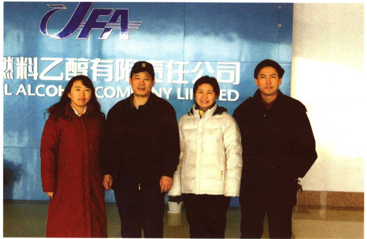
□ 作者在吉林燃料乙醇公司举办培训