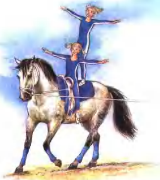
马背体操是一个团体体育项目，每队由8~15人组成。