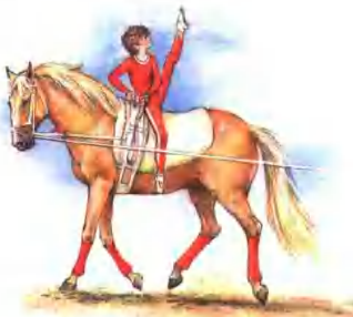
这个动作叫圆圆旋转。这个孩子一直坐在马鞍上，并使自己转过身来。