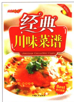
《经典川味菜谱》 定价:18.00元