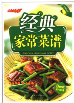
《经典家常菜谱》 定价:18.00元