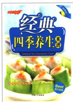
《经典四季养生菜谱》 定价:18.00元